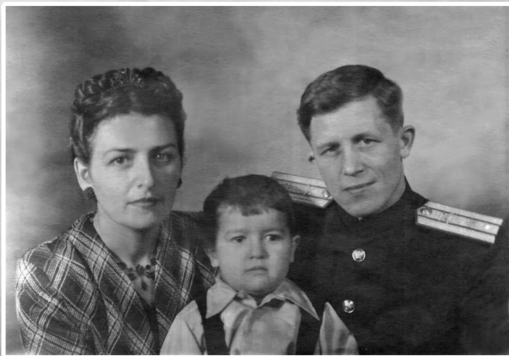
С родителями, 1947 г.

Когда мне было лет десять, мама купила мне «бобриковое» пальто. В те времена народ в нашем доме жил весьма скудно, все стеснялись ходить в хорошей одежде, чтобы не выделяться на общем фоне. Я специально упал с карусели в лужу, будто бы сорвался — пальто сразу стало не новым. Даже в институт я поступал в отцовс-