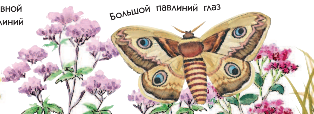
Большой павлиний глаз