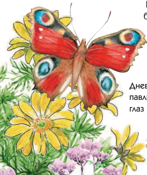
Дневной павлиний глаз

Большой павлиний глаз — самая крупная бабочка Европы. Размах её крыльев достигает 16 сантиметров. Яркие пятна на крыльях носят и дневные бабочки, не относящиеся к павлиноглазкам. Одна из них называется дневной павлиний глаз. Бабочку со сло-