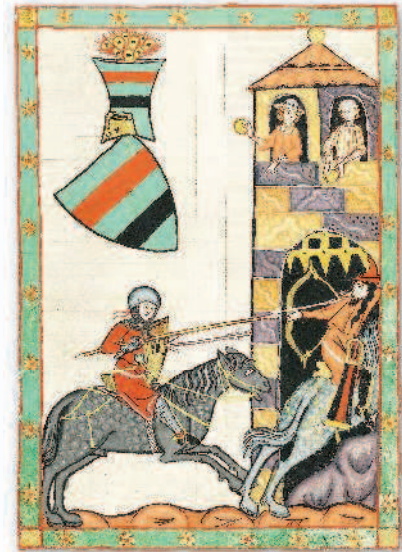
Рыцарь с кушированным копьем преследует вооруженного луком противника. Манесский кодекс, около 1300 г.