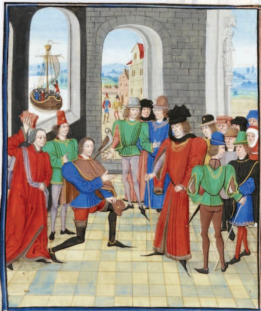
Вассал приветствует сеньора. Хроники Фруассара, 1410 г.