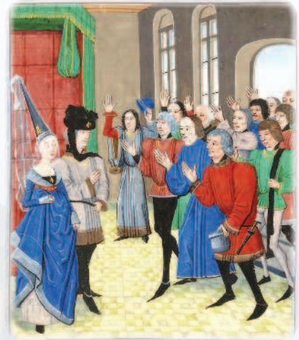
Принесение жителями Нанта оммажа Жану де Монфору. Хроники Фруассара, 1410 г.

сийском капитулярии официально утвердил право за сыновьями своих вассалов оставаться хозяевами бенефициев, пожалованных их родителям. Король также гарантировал, что бенефиции тех вассалов, которые не вернутся из похода, перейдут по наследству их сыновьям при условии несения ими военной службы. Таким образом, бенефиций (позднее по-германски его стали именовать феодом) превратился в наследственное владение. Это ознаменовало начало формирования феодально-вассальной системы.