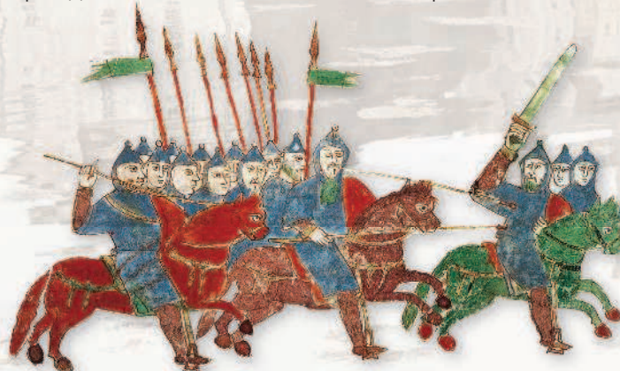
Победа германских тяжеловооруженных всадников над венграми. Энциклопедия Рабана Мавра, X в.

Летописи донесли до нас немало косвенных свидетельств реформы франкской армии. В 755 г. ежегодный смотр вооруженных сил (так называемые Мартовские поля) был перенесен с первого месяца весны на май, когда появлялась трава для прокорма лошадей.