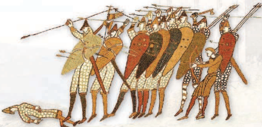
Англосаксы, сражающиеся в пешем строю в битве при Гастинге в 1066 г. Ковер из Байё, после 1080 г.

В раннем Средневековье на полях сражений доминировала пехота. Даже облаченные в доспехи знатные воины, выступавшие в поход верхом на коне, предпочитали сражаться спешившись. Подобные действия всадников ободряюще действовали на пехотинцев, которые видели в этом готовность занимающих более высокое положение соплеменников сражаться наравне с ними. Традиция пехотного боя достаточно долго сохранялась в Германии, Англии и Скандинавии.