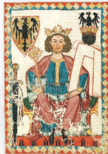
Германский император Генрих VI на троне с инсигниями власти. Манесский кодекс, около 1300 г.

а занятие военным делом сосредоточилось в руках немногочисленных профессионалов. Воином мог стать любой свободный человек, который приносил своему сеньору клятву, или оммаж. Присягающие на верность вассалы (именно так называли этих людей) получали покровительство господина взамен на свою преданность.