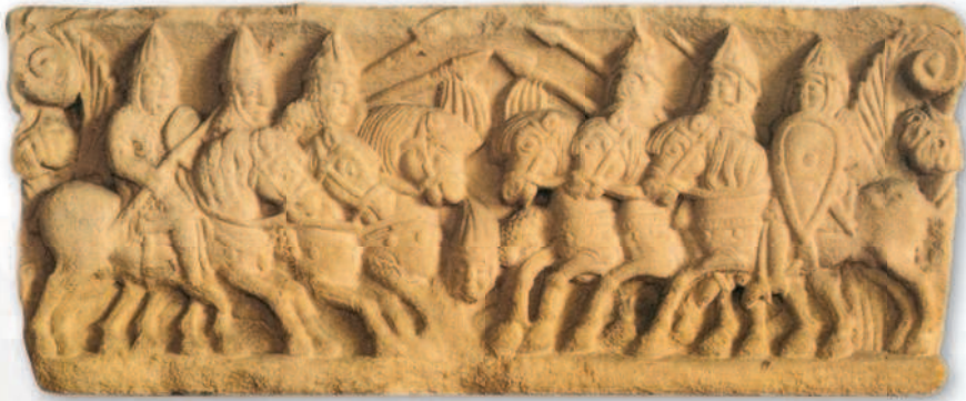
Сражающиеся рыцари. Рельеф над порталом собора в Ангулеме, около 1135 г.

Результатами начатых Карлом Мартеллом реформ воспользовался сполна его внук, Карл Великий, чье длительное правление — с 768 по 814 г. — прошло в непрерывных войнах. Ударная мощь тяжелой кавалерии, ее стратегическая и тактическая подвижность неизменно обеспечивали успех военным начинаниям франкского короля. Его многочисленные воины не зависели от цикла сельскохозяйственных работ и могли совершать дальние походы в любое время года. Они были хорошо вооружены и мобильны. Капитулярий 805 г. предписывал владельцам 20 мансов (около 200 гектаров) земли являться на службу со своим конем и защитным вооружением. В случае же неявки принадлежавшие им бенефиции и доспехи конфисковывались. Те, кто владел меньшим количеством земли, служили в пехоте. Бедняки обязаны были снаряжать воина в складчину. Согласно подсчетам историков, армия франков в среднем могла насчитывать от 2,5 до 3 тысяч всадников и примерно от 6 до 10 тысяч пехотинцев. Во время крупных кампаний собиралось 20 тысяч воинов, полная мобилизация могла дать порядка 35 тысяч всадников.