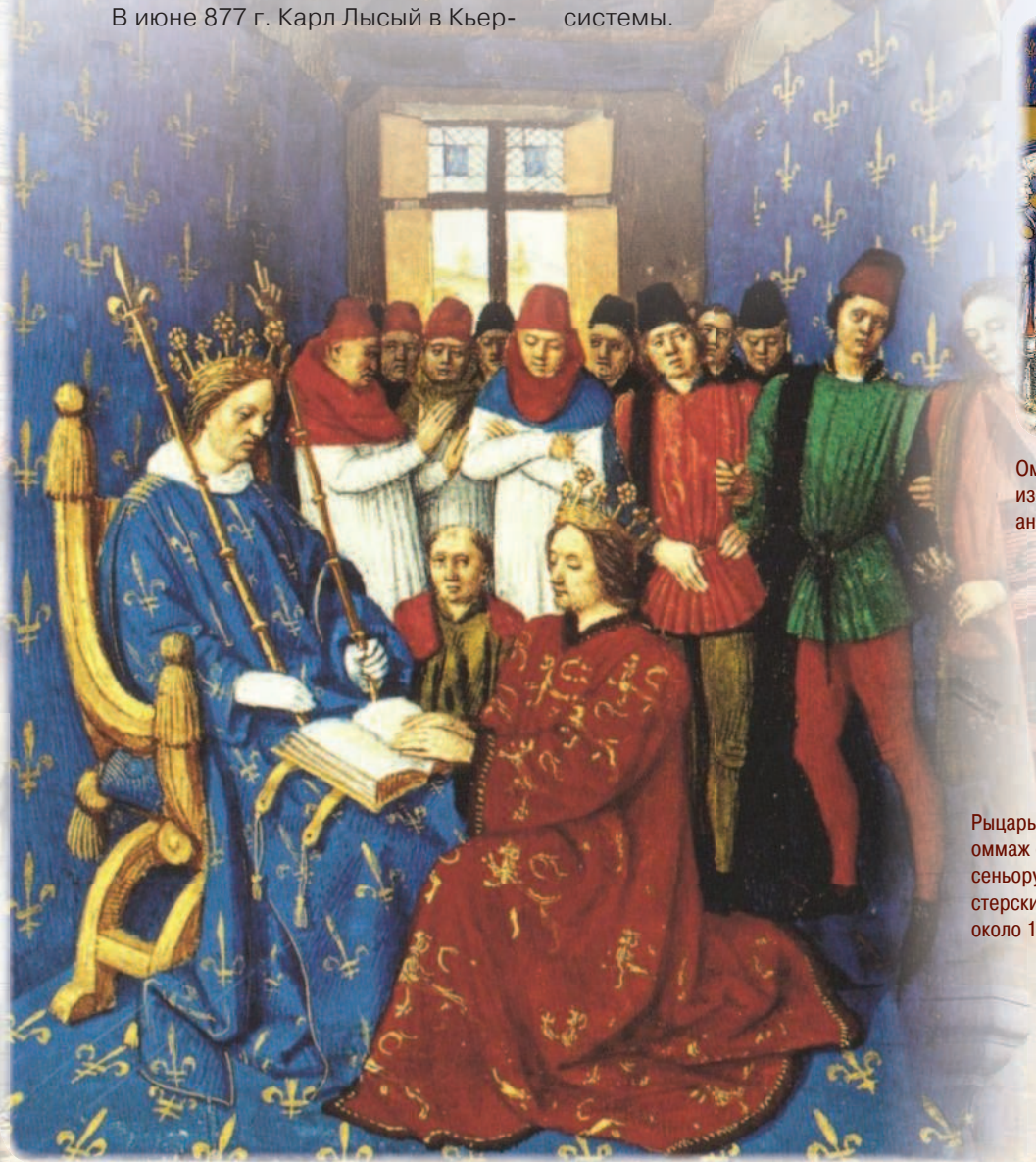
Оммаж Эдуарда I Филиппу Красивому на владение Гасконью. Большие французские хроники, около 1375 г.