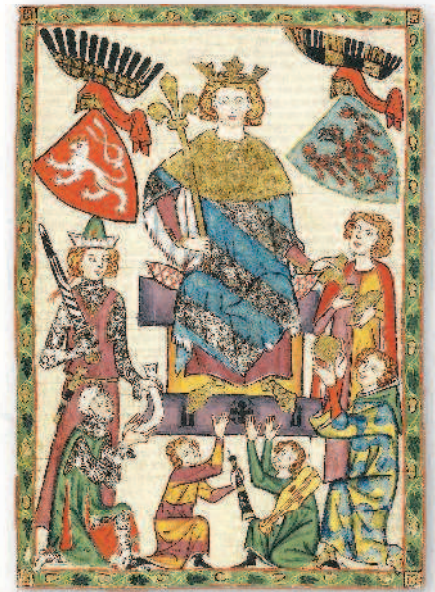
Французский король в окружении свиты, музыкантов и слуг. Манесский кодекс, около 1300 г.