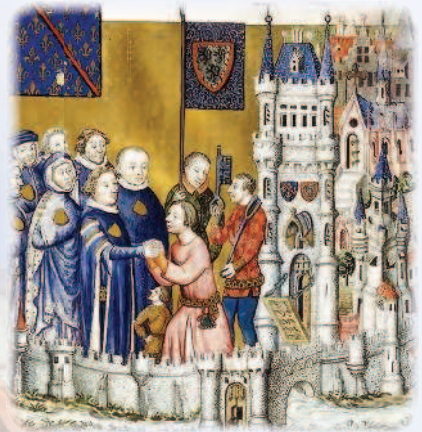
Оммаж графа Клермонского. Миниатюра из книги «Оммажи герцогства Клермон-ан-Бовези», 1373–1376 гг.