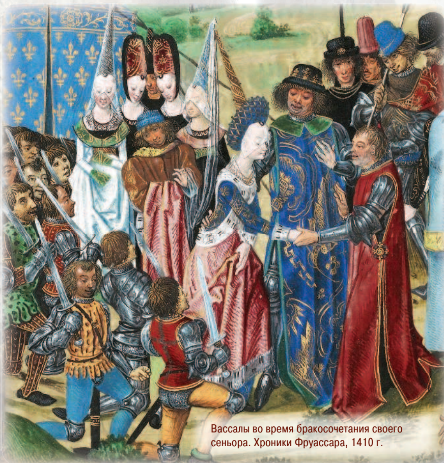
Вассалы во время бракосочетания своего сеньора. Хроники Фруассара, 1410 г.

единство феодального класса, основанное на клятвах верности и обязанности служения. Однако на практике эта система работала плохо, поскольку мелкие рыцари, находящиеся в основании феодальной лестницы, были склонны скорее подчиняться своим непосредственным сеньорам — герцогам, графам и баронам, нежели королю. Во Франции и многих других странах действовало правило: «Вассал моего вассала — не мой вассал», которое означало, что непрямым вассалом короля не был обязан выполнять его распоряжения. Реальная власть находилась в руках графов и баронов, сохранявших лишь номинальную зависимость от своего сеньора. В итоге эта система способствовала увеличению феодальной раздробленности и междоусобных конфликтов, охвативших Западную Европу в XI–XII вв. Основным участником этих столкновений был образованный системой феодально-вассальных отношений класс рыцарей.