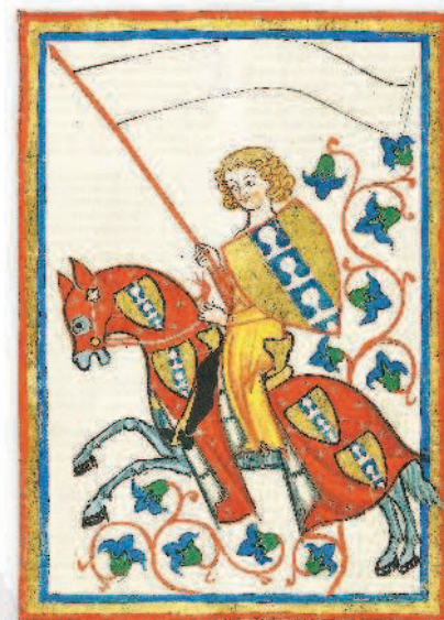
Рыцарь означает «всадник». Манесский кодекс, около 1300 г.

ным событием в деле появления кавалерии в армиях европейских государств стало сражение при Пуатье 10 октября 732 г., в котором Карл Мартелл одержал победу над арабами. Несмотря на успех, сопутствующий его пехоте, Карл оценил кавалерию и осознал ее значение на поле боя. Отныне не пехота, а тяжелая кавалерия должна была стать ос-