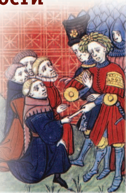
Вассал выполняет службу своего сеньора. Большие французские хроники, около 1375 г.

Феодално-вассальная система являлась основой политического строя средневековой Европы и была призвана обеспечивать