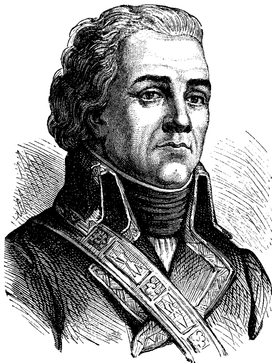
Жак-Франсуа Дюгомье (1738–1794). Гравюра Э. Тома с оригинала А. Руссо. Из «Альбома столетия...» (Париж, 1889)

Лионская армия была распределена между Альпийской, Пиренейской и Тулонской. Подкрепление оказалось не столь велико, каким могло бы быть. Вместе с ним в осадной армии находилось только 30 000 человек, считая и плохие, и хорошие войска. Главнокомандующий союзными войсками генерал О'Хара поджидал подкрепление из 12 000 пехотинцев и 2000 кавалеристов. Он надеялся добиться снятия осады, захватить олиульский парк, обойти французскую армию в Италии, а затем, соединившись с пьемонтской, расположиться на зимних квартирах по Дюранс и овладеть всем Провансом. В этой провинции не доставало продовольствия. Несколько попыток подвезти припасы, предпринятых марсельскими купцами, остались безрезультатными по причине занятия противником Тулона и присутствия английского, испанского и неаполитанского флота в Средиземном море. Эта часть республики возлагала все свои надежды на скорое падение Тулона, а между тем за четыре месяца с начала осады было обстреляно, по слухам, лишь одно полевое укрепление, расположенное в стороне от крепостных фортов; неприятель спокойно владел не только городом и фортами, но и всем пространством между городом, горою Фарон и фортом Мальбоске. Все усилия осаждающих предпринимались в направлении, противоположном городу, и это возбуждало общее неодобрение. Полагали, что осада даже не начиналась, так как против фортов и со-