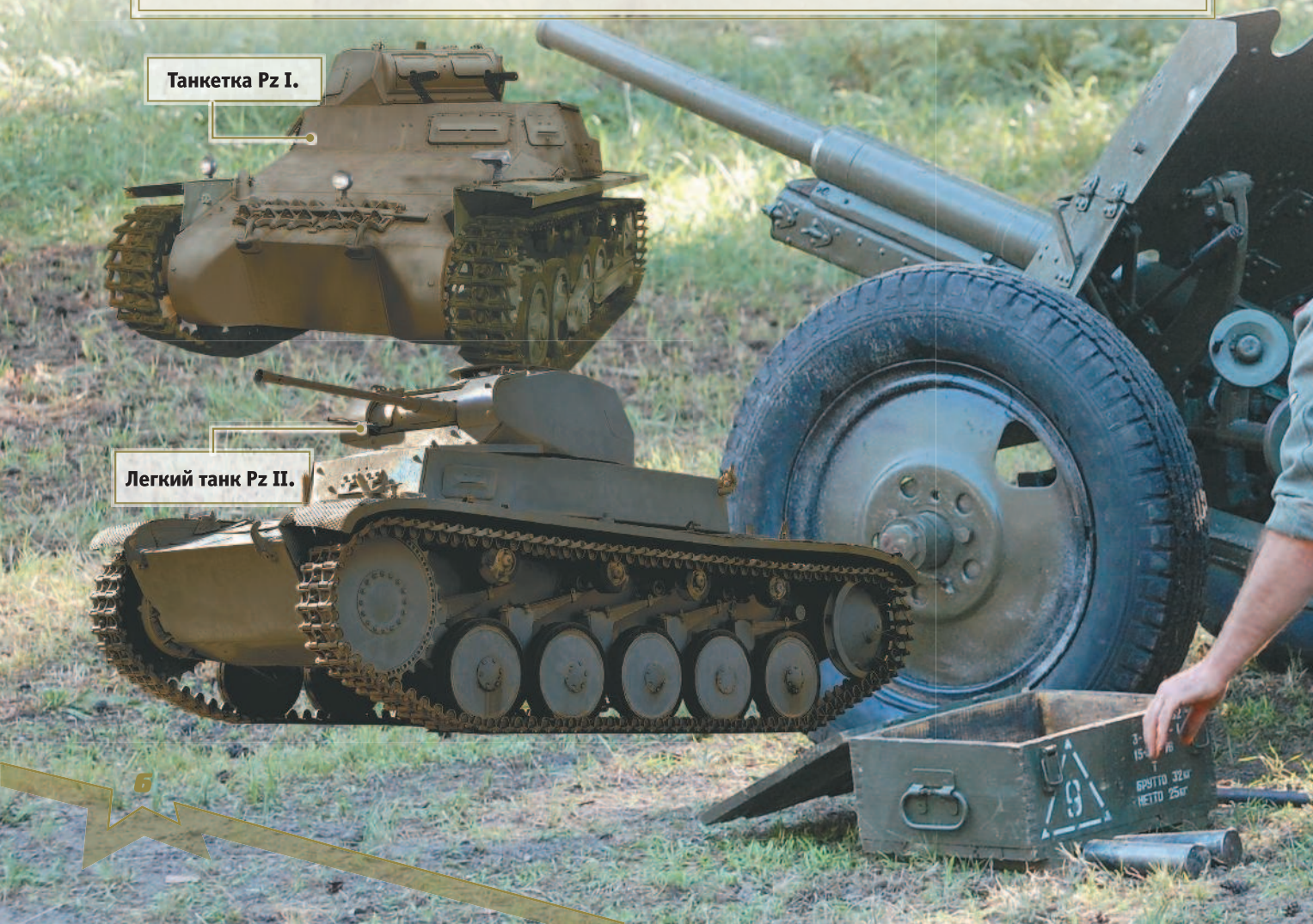
Легкий танк Pz II.