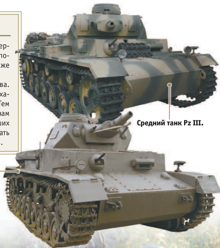
Средний танк Pz III.

Pz IV разрабатывался как тяжелый танк прорыва. Однако в момент создания он едва дотягивал по характеристикам до советского среднего танка Т-34. Тем не менее в дальнейшем германским конструкторам удалось довести конструкцию Pz IV до уровня лучших стандартов. Танкам Pz III и Pz IV суждено было стать «двигателем» вермахта времен его побед и успехов.