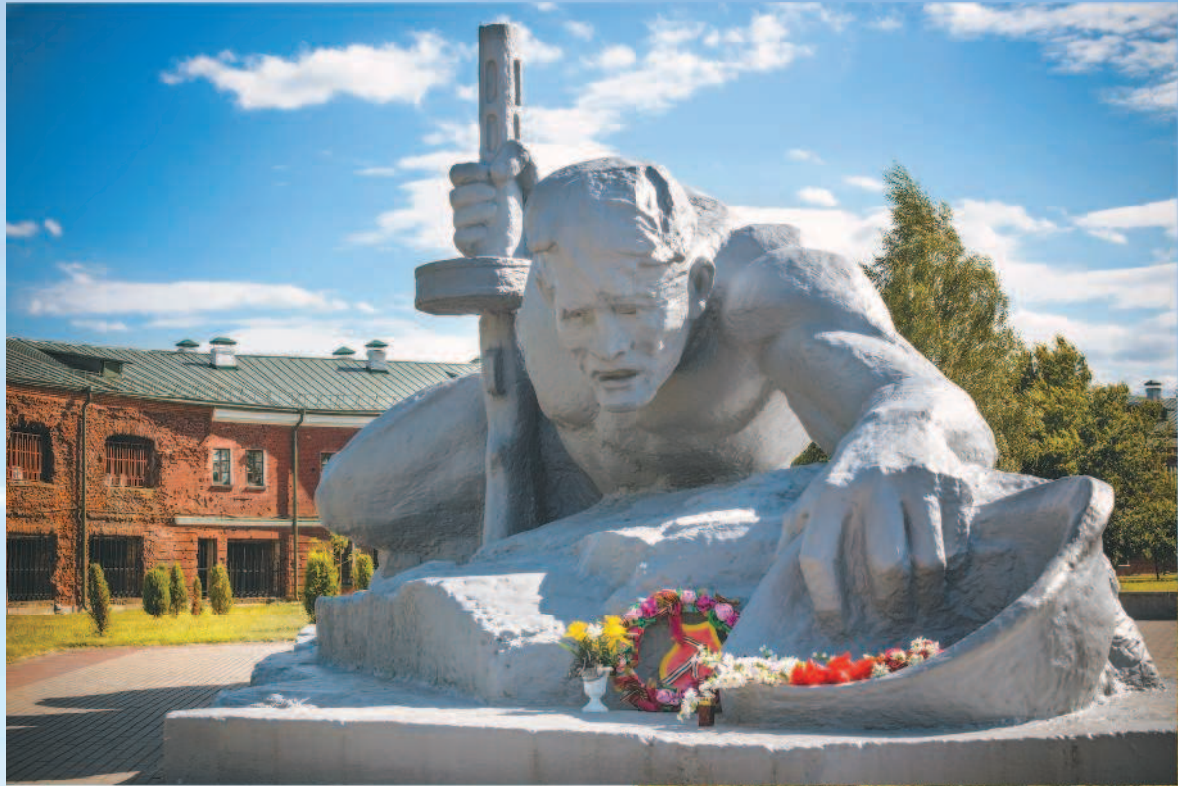
Памятник советскому солдату в мемориальном комплексе Брестской крепости-героя.