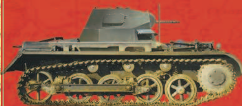
100 СОВЕТСКИХ ТАНКОВ