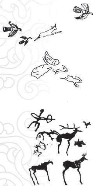
Половецкое поле — Великая Степь

ни в Южной России. Порой казалось, что распахи- ваю нетронутую целину. Но Половецкое поле, его история уже не отпускали меня, своего вернопод- данного.