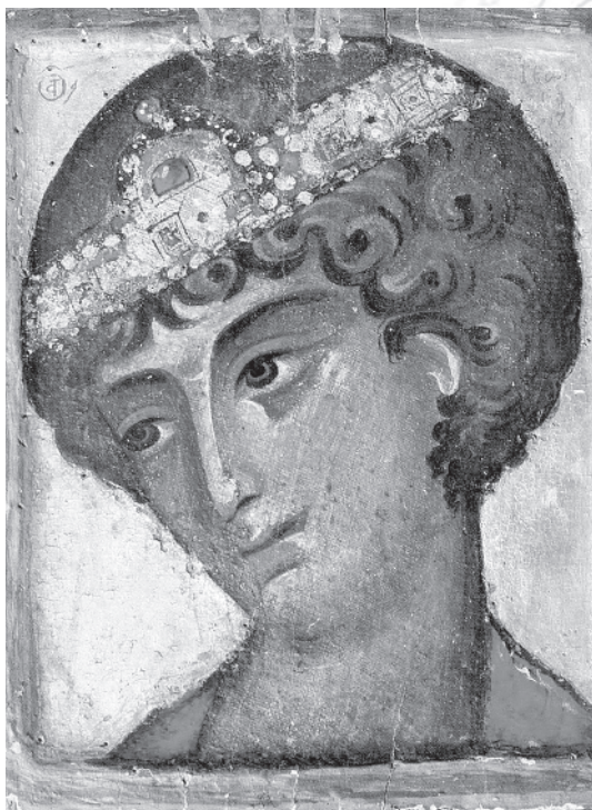
Святой Георгий оплечный. Монастырь святой Екатерины на горе Синай. Кон. XII — нач. XIII в.

Чей «наш?» Спросить уже не у кого, бабушки давно нет с нами. Осталось ощущение тайны, которое до поры до времени дремало где-то в подсознании, никак себя не проявляя.