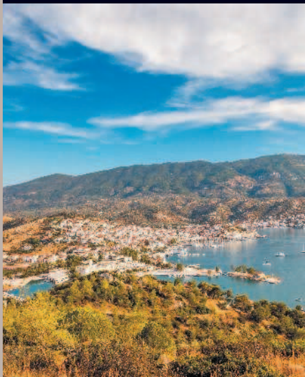
Город на побережье Саронического залива