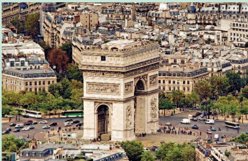
На площади Шарля де Голля (до 1970 г. площадь Звезды), где установлена одна из трех триумфальных арок, пересекаются шесть улиц, их двенадцать лучей расходятся во все стороны.

Пожалуй, самым узнаваемым символом французской столицы является Эйфелева башня. Отсюда начинается Марсово поле, территория которого ранее использовалась для военных парадов и патриотиче-