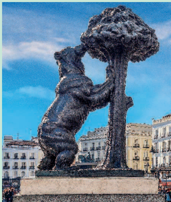
Гербовый символ столицы Испании — скульптура «Медведь и земляничное дерево», созданная скульптором Н. Сантафе в 1966 г.

Мадрид – один из центров страстного фламенко. Взрывная энергия танца, музыки и песни, слитые воедино, как нельзя лучше отражает динамичный характер города. Ключевую роль в развитии фламенко Мадрид начал играть с середины XIX в., когда здесь стали появляться «кафес кантантес», питейные заведения с живой музыкой, где собиралась небогатая публика. Места, где байлаоры (танцоры), токаоры (гитаристы) и кантаоры (певцы) делятся со зрителем своим совместным творчеством, носят название таблао. Подобных заведений, позволяющих гостям насладиться истинным фламенко за бокалом вина и отменным ужином, сегодня в Мадриде немало. Однако столики в них надо бронировать заранее.