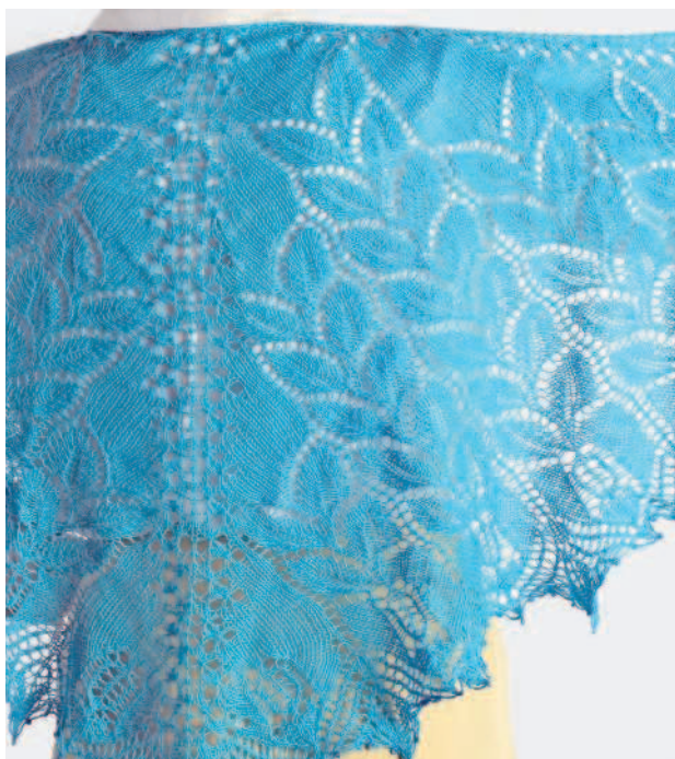
Шаль «Девичий виноград»