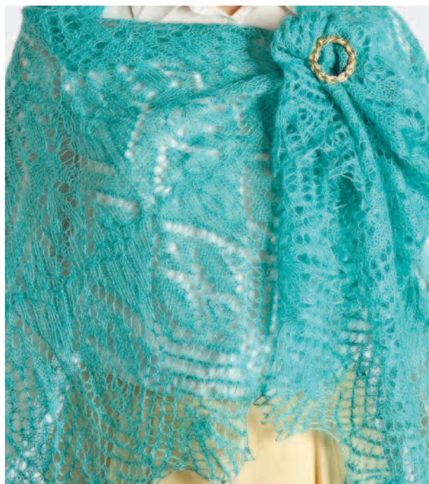
Шаль «Эльфийская принцесса»