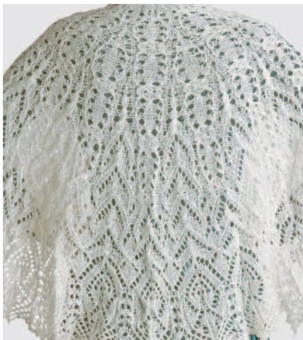
Шаль «Снежный вальс»