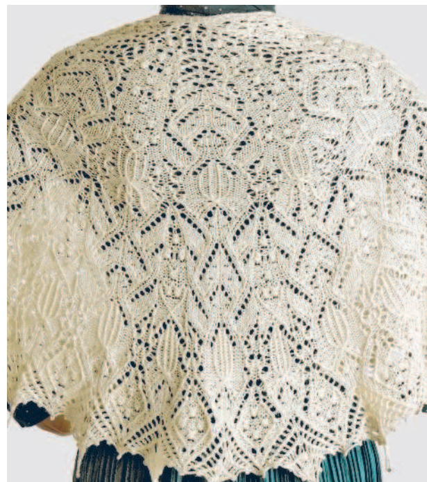
Шаль «Бархатный сезон»