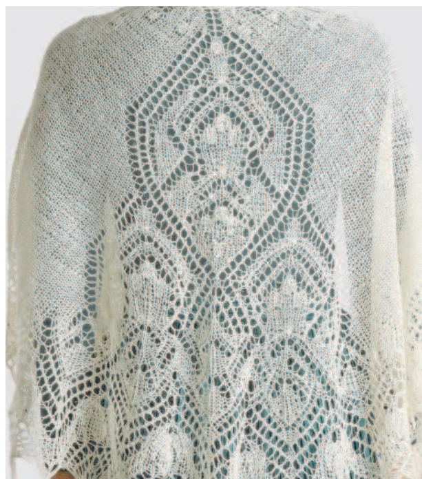
Шаль «Майский дождь»