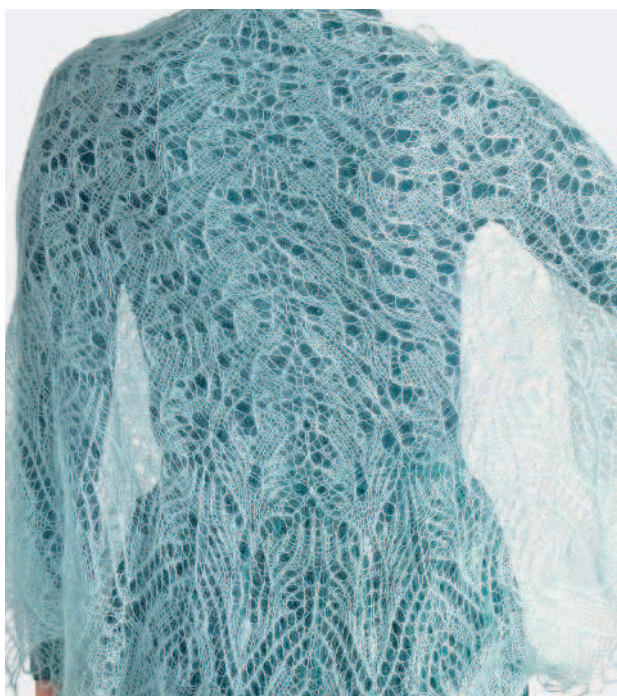
Шаль «Паутинка осени»