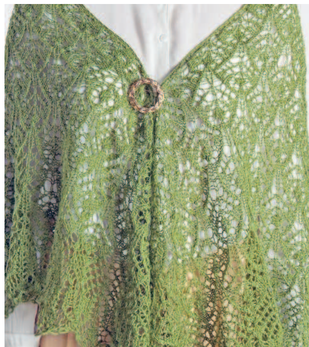
Шаль «Лесная нимфа»