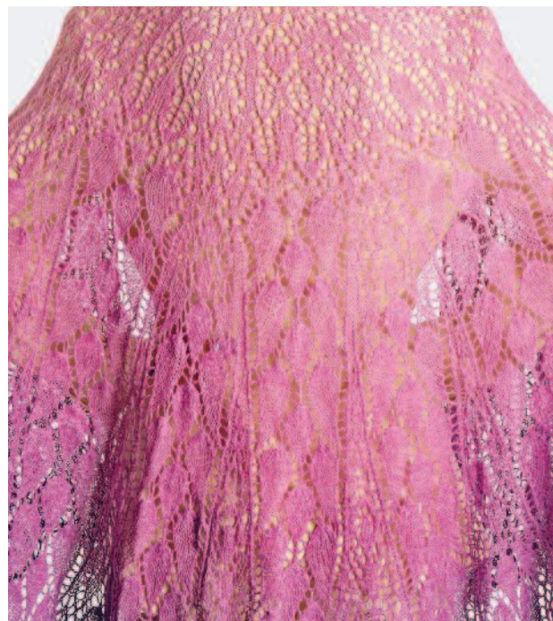
Шаль «Сказки Венского леса»