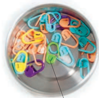
маркеры для вязания

можно отметить на полотне начало раппорта или первый ряд узора, место прибавления и убавления петель. Они бывают разной конструкции, в виде колец и подвесок, разъемные и неразъемные. В своей работе я часто применяю самые простые разъемные маркеры, чтобы отметить начало и конец раппортов или выделить центральный мотив шали. Вместо них, вы можете взять отрезок нити контрастного цвета, английскую булавку или канцелярскую скрепку.