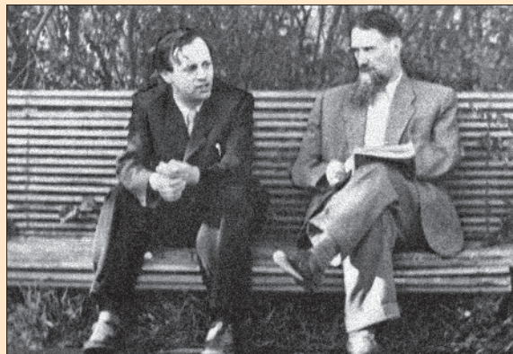
А.Д. Сахаров и И.В. Курчатов

Конец 1940-х — начало 1950-х гг. стали кульминацией «холодной войны». В США на случай войны разрабатывались планы атомной бомбардировки Советского Союза. Первостепенной задачей стало создание собственного ядерного оружия.