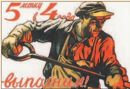
В.С. Иванов. Плакат. 1948 г.

Руководство страны направило в эти районы основные трудовые и финансовые ресурсы. В марте 1946 г. ЦК ВЛКСМ призвал комсомольцев к участию в восстановлении 15 старейших русских городов. Только на восстановление Днепрогэса комсомол направил 26 тыс. юношей и девушек. Со всех концов страны туда шли эшелоны с цементом, машинами и оборудованием.