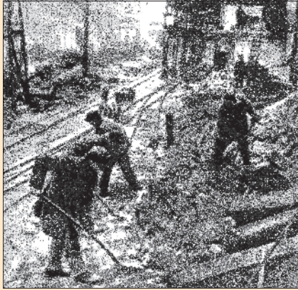
Восстановление ТЭС завода им. Г.И. Петровского. Днепропетровск. 1945 г.

от военной экономики к мирной предстояло совершить в ходе реализации четвёртого пятилетнего плана (1946–1950).