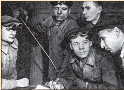
Сталевары-«скоростники» Кузнецкого металлургического комбината. 1945 г.

дукции: радиолокационной аппаратуры, реактивных двигателей, ракетного топлива и т.д. В короткий срок родилась атомная промышленность, первоначально имевшая целью создание атомного оружия, но в дальнейшем послужившая основой для грандиозных мирных проектов: строительства атомных электростанций и атомных ледоколов. Одновременно сотни заводов и фабрик осуществляли конверсию (переход военных заводов на производство мирной продукции) и реконверсию (возвращение гражданских предприятий к продукции мирного времени).