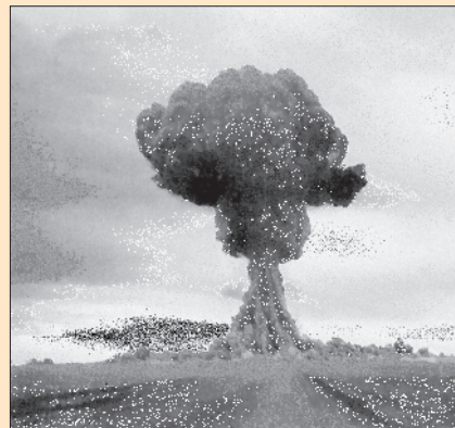
Испытание атомной бомбы на Семипалатинском ядерном полигоне. 1949 г.