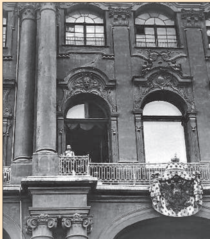
Николай II на балконе Зимнего дворца перед провозглашением Манифеста о вступлении в войну. Санкт-Петербург. 20 июля 1914 г.

С самого начала войны в России провозгласили Германской, Великой, Второй Отечественной. Патриотические настроения в обществе ободрили царя. Казалось, в народе наступило единодушие. 20 июля (2 августа) 1914 г. в Петербурге на Дворцовой площади прошла манифестация в поддержку войны под лозунгами солидарности со славянскими народами и защиты их от тевтонской агрессии. А когда император и императрица вышли на балкон Зимнего дворца, десятки тысяч людей дружно опустились на колени. Манифестанты с воодушевлением спели гимн «Боже, Царя храни!». В тот же день вышел царский Манифест, в котором подчёркивались традиционное миролюбие России и агрессивность Германии. Документ призывал всех россиян забыть внутренние распри, «оградить честь,