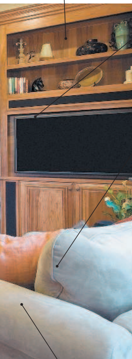
die Vitrine сервант