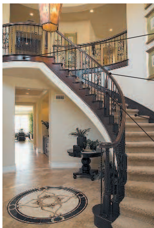
landing лестничная площадка