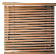
venetian blind жалюзи