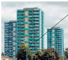
block of flats многоквартирный дом