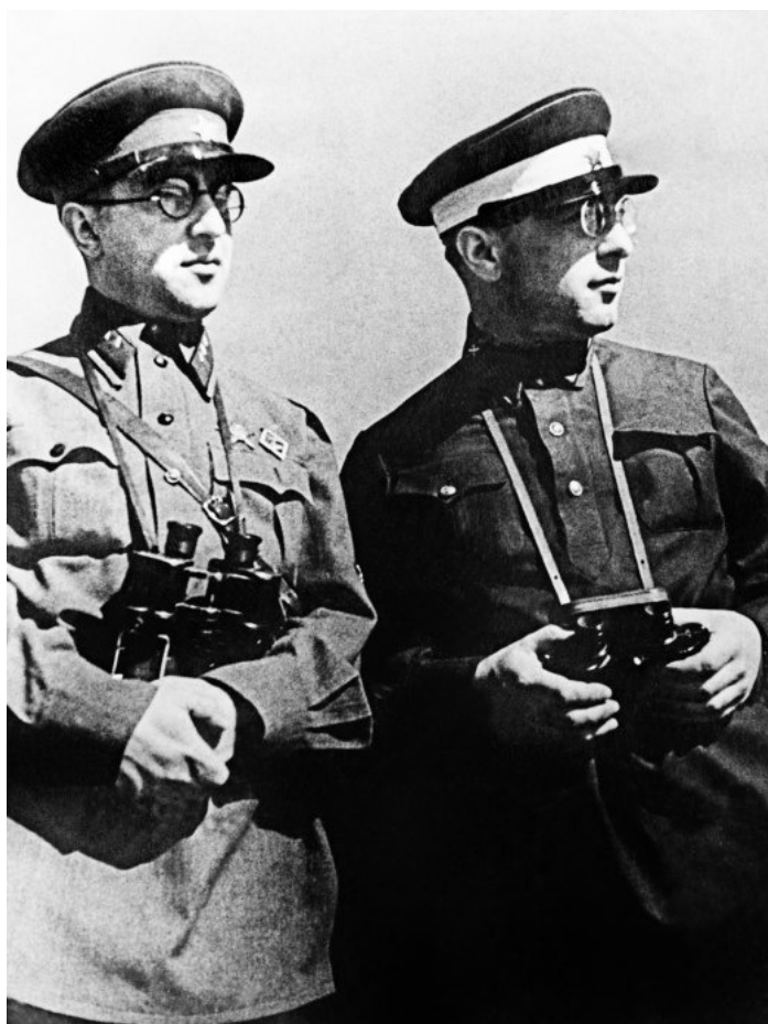
М. Кольцов, Б. Ефимов. Под Киевом, 1935 г.