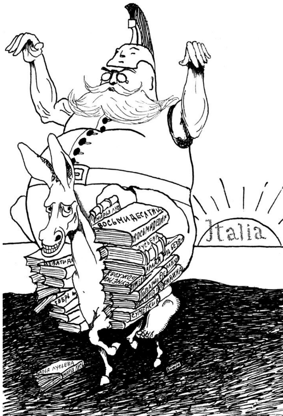
Шарж на известного в то время писателя, публициста А. Амфитеатрова. Вместе с шаржем на Родзянко председателем Думы был отправлен в Петроград для публикации в журнале «Солнце России», но, в отличие от шаржа на Родзянко, не был напечатан. Под рисунком стоит подпись «Бофри» — Борис Фридлянд, приблизительно 1916 год. Публикуется впервые.