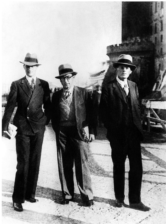
Е. Петров, Б. Ефимов, И. Ильф. Неаполь. 1 ноября 1933 года