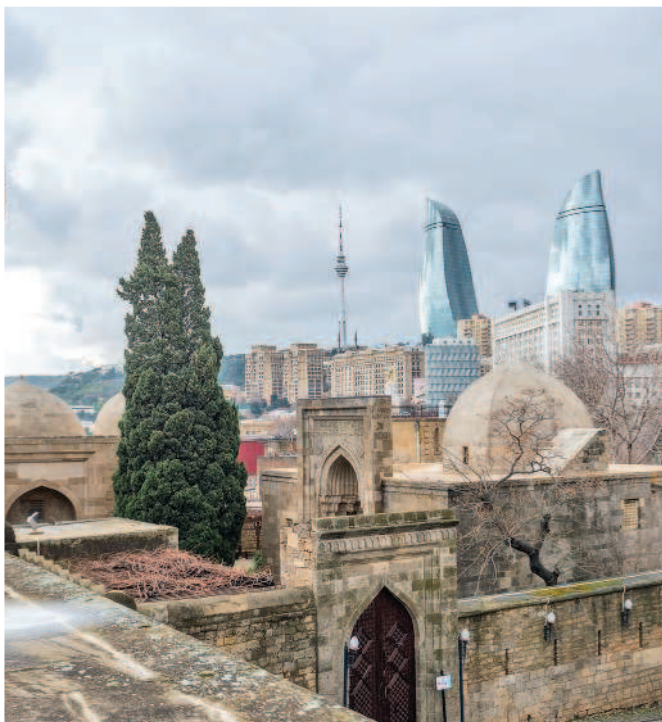
Старый и новый символы Баку: Дворец Ширваншахов и Пламенные башни