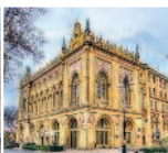
Шемахинские ворота Дворец Ширваншахов Дворец Исмаилия