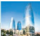
Биби-Эйбат в сумерках Центр Гейдара Алиева Пламенные башни