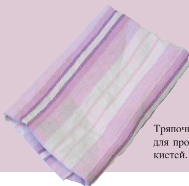
Тряпочка для протирки кистей.

Это может быть как чистая ветошь, так и кусок мягкой хлопковой ткани или нетканого полотна. В любом случае ее предназначение — хорошо впитывать воду. С помощью