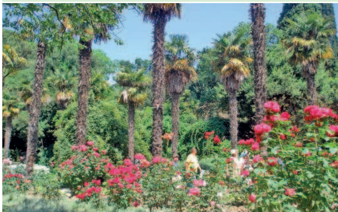
Розы в Никитском ботаническом саду