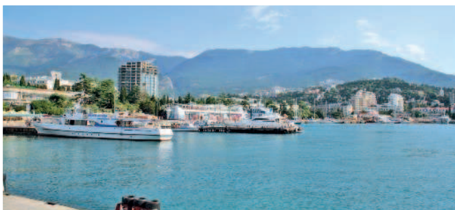
Вид на Ялту

В марте 2014 г. Крым после 23 лет пребывания в составе Украины вернулся в состав России благодаря проведенному там референдуму и сразу же занял ведущее место среди курортов нашей страны.