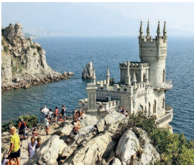
Ласточкино гнездо – эмблема Южного берега Крыма