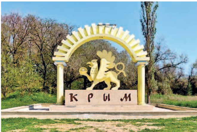
Въезд в Крым