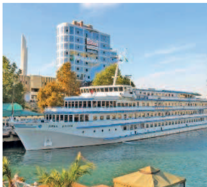
Пароход «Звезда Днепра» в Севастополе