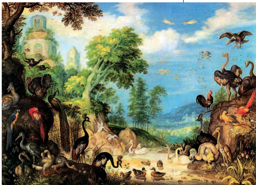
Рулант Саверей. «Птичий пейзаж». 1628 г. В нижнем правом углу — дронт.

Маврикийский дронт, или додо, — это вымершая нелетающая птица, которая была эндемиком острова Маврикий в Индийском океане. Маврикийские дронты были около метра в высоту и, возможно, весили до 21 кг. О внешнем виде маврикийских дронтов можно судить только по рисункам, изображениям и письменным источникам, поэтому о прижизненном облике этой птицы доподлинно неизвестно.