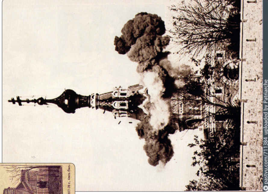
Разрушение Храма-усыпальницы русских воинов