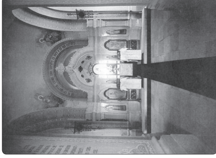
Интерьер русского храма-памятника в Сан-Стефано