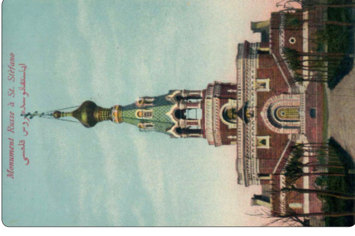
Русский храм-памятник в Сан-Стефано. Почтовая открытка