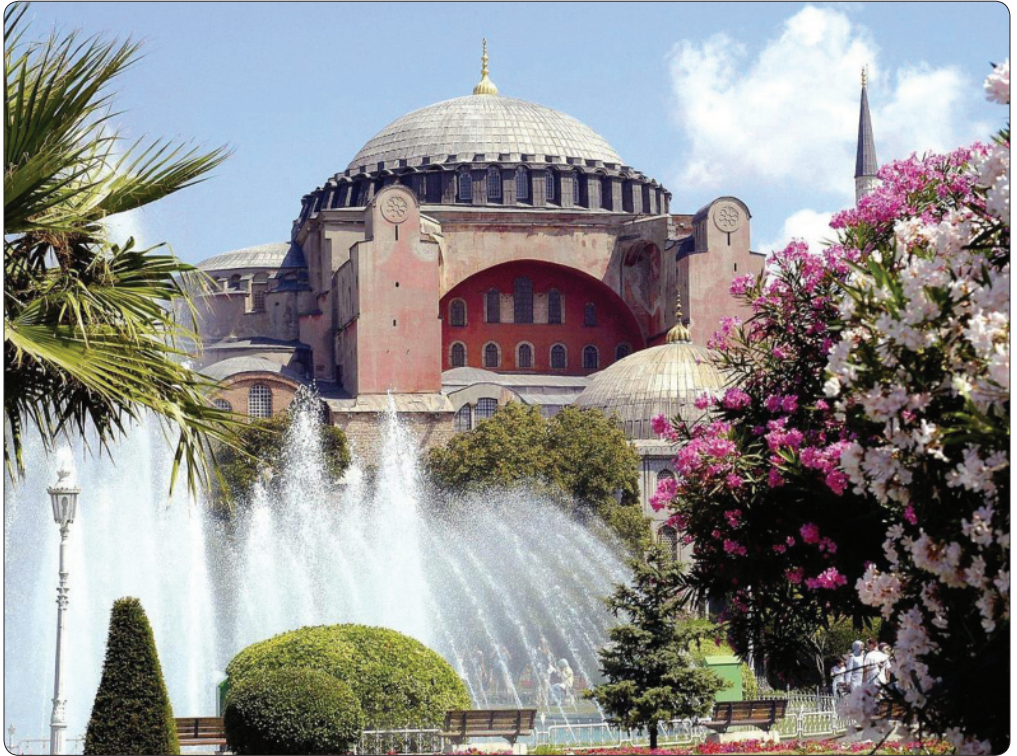
Храм Святой Софии в Константинополе