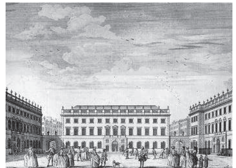
Королевский госпиталь Святого Варфоломея. 1752 г.