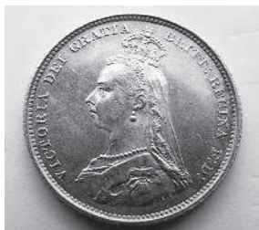
Шиллинг с изображением королевы Виктории. 1887 г.

«...насколько может быть свободен человек, получающий одиннадцать шиллингов и шесть пенсов в день». Шиллинг ( shilling ) — общее название европейских монет, произошедшее от солида — римской золотой монеты. В Англии долгое время был лишь денежно-счетной единицей (до нормандского вторжения равнялся 5 пенсам, после него и вплоть до 1971 года — 12 пенсам; 20 шиллингов равнялись 1 фунту стерлингов). Но как монета стал чеканиться лишь в 1502 году в правление Генриха VII. В конце XIX века 11 шиллинг в день — средняя сумма, впрочем немалая. За один шиллинг на городском базаре можно было купить самое дорогое кушанье того времени — ананас! Пузырек с лекарством стоил полтора шиллинга. А торговцы на рынке, как свидетельствуют, получали «баснословные деньги», а именно 20—30 шиллингов в день! Одно время Доил подрабатывал помощником врача в Бирмингеме, и некий доктор Хор, как свидетельствуют биографы, ему неплохо платил — два фунта в месяц, т. е. 40 шиллингов. На большее студент-медик, еще пока недоучка, претендовать и не мог. Но Доил смог за полгода скопить неплохую сумму — практика, которой следует каждый британец: главное не уровень дохода, а умение экономить! Пенни ( penny ), иногда пенс ( pence ) (во мн. ч. пенсы ( pence )) для начисления суммы, пенни ( pennies ) для нескольких монет) — английская монета, чеканившаяся с XI века из серебра, меди, бронзы, а также разменная монета современного Соединенного Королевства, составляет сотую долю фунта стерлингов.