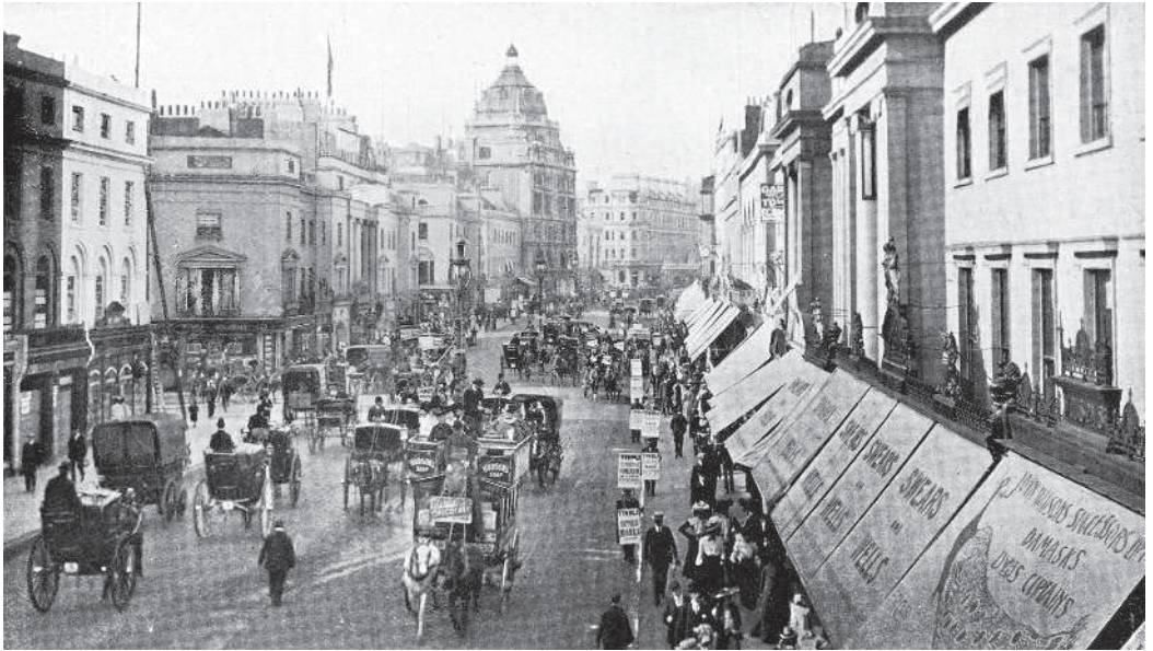
Лондон. Конец XIX в.

«В подобных обстоятельствах меня, естественно, потянуло в Лондон, в этот отстойник, куда непреодолимо стекаются все празднующиеся бездельники империи». За XIX век Лондон стал крупнейшим городом мира. Его население в 1800 году составляло 1 млн, а веком позже — 6,7 млн. За это время Лондон стал всемирной политической, торговой и финансовой столицей. Отстойником город назван поскольку, несмотря на то что здесь строились фешенебельные районы, Лондон XIX века был городом нищеты, где миллионы людей