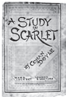
«Этюд в багровые тонах». Первое отдельное издание. 1888 г.

Этюд в багровых тонах ( A Study in Scarlet ). Первоначальное рабочее название «Запутанный клубок» ( The Tangled Skein ). Именно с этой повести Дойл становится известен как писатель детективов и воспринимается чуть ли не основателем этого жанра. Но на момент создания «Этюда в багровых тонах» уже было опубликовано множество детективных историй. Их писали Чарльз Диккенс, Уилки Коллинз и др. Сам Дойл называет только двоих писателей, на чье творчество он опирался: Эдгар По и Эмиль Габорно.