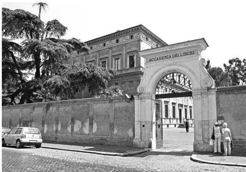
Рис. 1. Вход во двор виллы Фарнезина. За забором видно здание самой виллы. Фотография 2005 года.