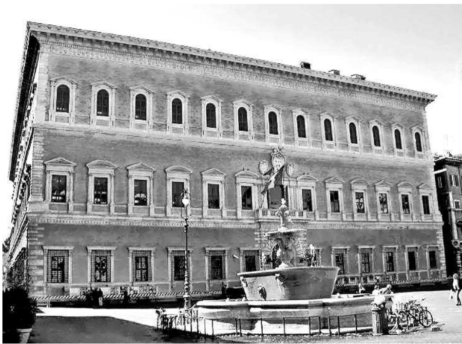
Рис. 6. Дворец Фарнезе (Palazzo Farnese) в Риме. Якобы середина XVI века. Сегодня во дворце размещается посольство Франции и постороннему попасть туда нельзя.

вила расположена прямо напротив родового дворца Фарнезе — палаццо Фарнезе, по другую сторону Тибра от него. См. рис. 6. Было бы очень естественно выбрать место для загородной — то есть, расположенной за Тибром — виллы прямо напротив основного дворца. Кстати, во дворце Фарнезе также, по-видимому, есть росписи с зодиаками. См., например, рис. 7. Было бы полезно найти их подробные изображения, датировать их и сравнить с датами, указанными на зодиаках виллы Фарнезина. Однако нам пока не удалось это сделать. Во дворце Фарнезе расположено посольство Франции, и доступ посторонним туда закрыт.