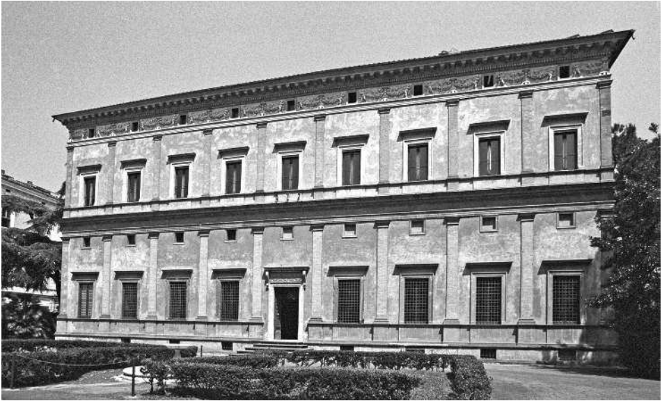
Рис. 3. Вилла Фарнезина со стороны черного хода. Вход в музей здесь. Фотография 2005 года.