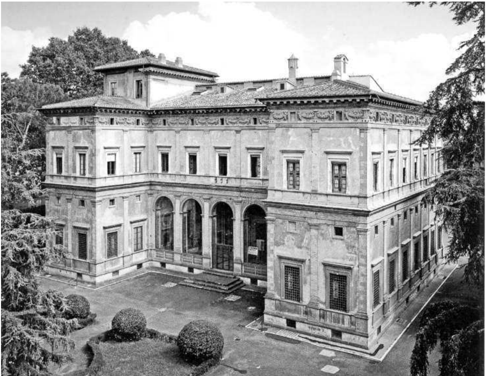
Рис. 4. Вилла Фарнезина со стороны парадного хода. Взято из [1238:2], с. 17.