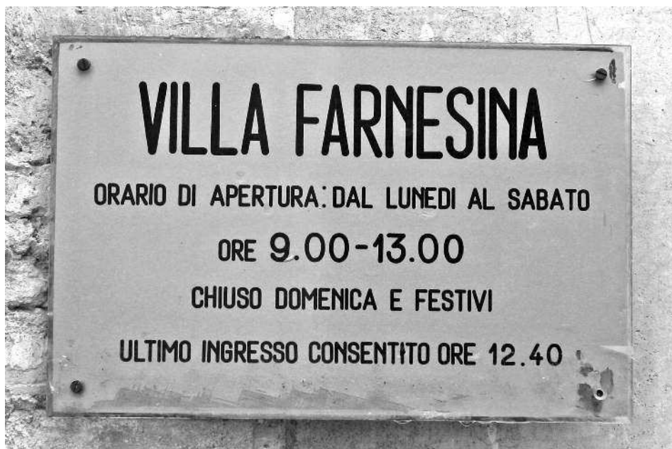
Рис. 2. Табличка перед входом во двор виллы Фарнезина с расписанием работы музея. Фотография 2005 года.