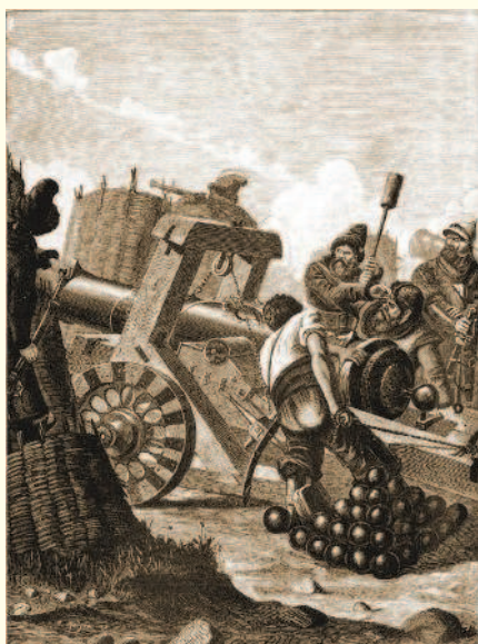
Русское осадное орудие XVI века