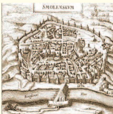
Смоленск. Старинная гравюра

кая стена протяженностью 6500 м с 36 башнями. Несмотря на свою мощь, крепость находилась в плохом состоянии, так как на ее поддержание и ремонт почти не выделялось средств. Гарнизон крепости насчитывал примерно 3500–4000 человек, не считая жителей. Большая часть населения демонстрировала открытые симпатии к Русскому государству.