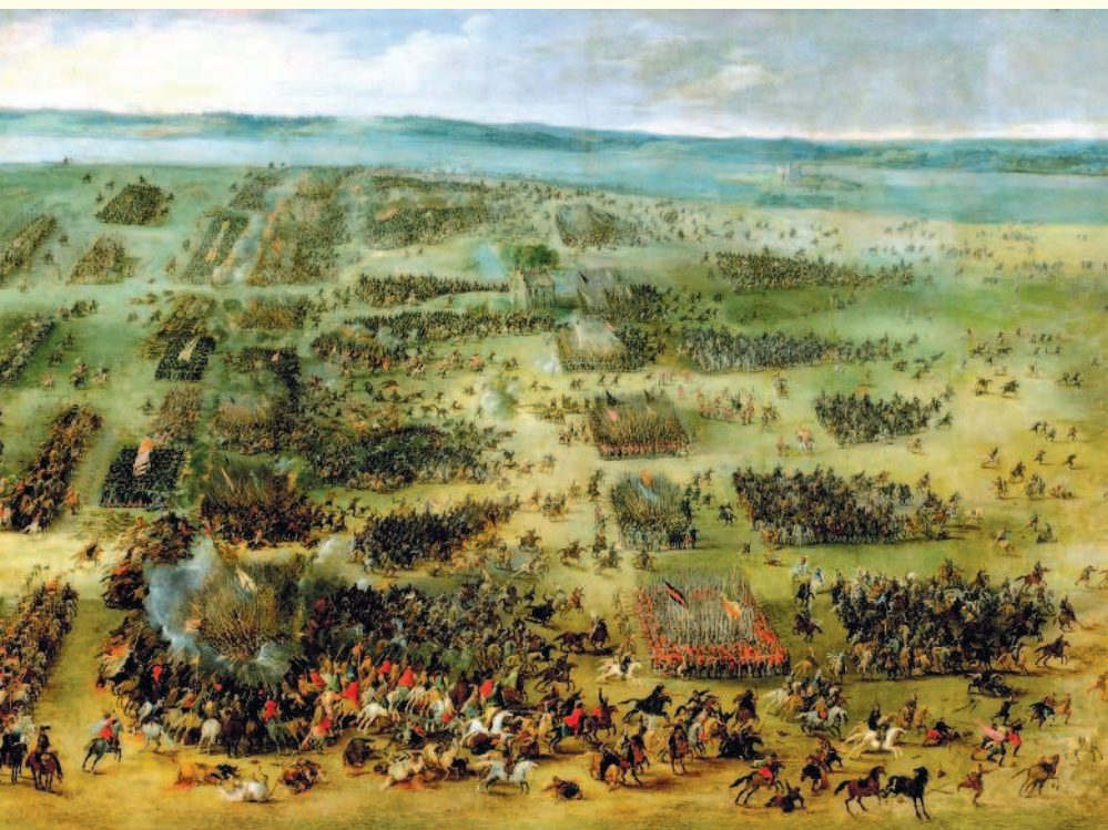
Неизвестный художник. «Битва под Брестом»

Бога и у Пречистой Его Богоматери Пресвятей Богородицы и у всех небесных сил помощи просить и молебствовать, и воду велели святить и твоих Государевых ратных людей кропить».