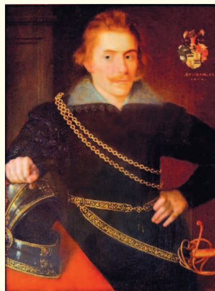
Делагарди Якоб Понтусон

вспыхнуло восстание, в результате которого город перешел под власть Москвы. Так началась борьба против шведской оккупации.