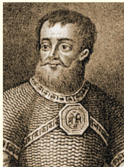
Яков Кунедетович Черкасский