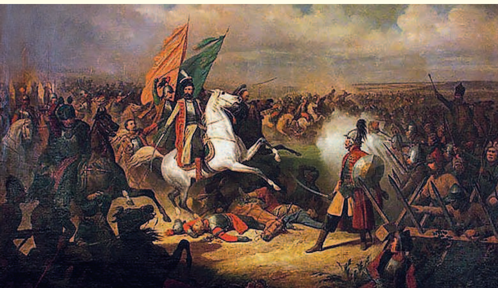
Януарий Суходольский. «Стефан Чарнецкий во время Русско-Польской войны»

Русская дворянская конница не была готова к бою, и ее рассеяли. Князь с войсками отступил за Буг и занял оборону за обозными повозками. Но вскоре русские войска выбили и оттуда. Русские отступили в деревню Верховичи в 25 верстах от Бреста. Поляки вышли к селению и блокировали русский отряд.