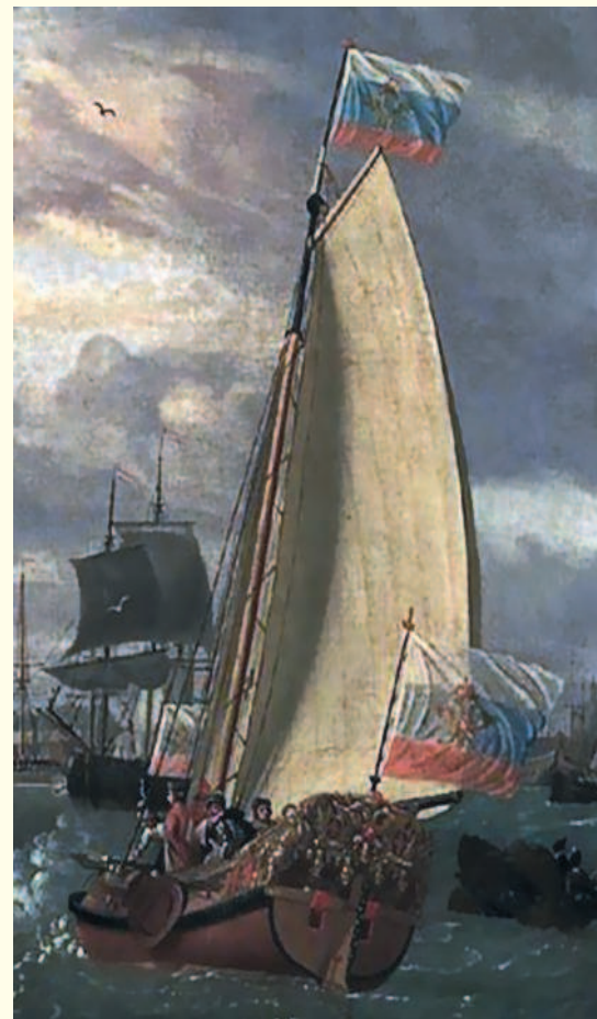
Абрахам Шторк. «Петр I на яхте следует на новое судно «Петр и Павел»

На море русским противостоял регулярный шведский флот, который до поражения в Северной войне в начале XVIII в. был одним из сильнейших в мире. Шведский флот долгое время господствовал на Балтике во многом именно благодаря галерным эскадрам, удобным для действий в узких шхерах и на мелководье. Малые галеры имели длину до 30 метров, ширину до 5,5 метра, 12–18 пар весел и одну-две мачты с косыми латинскими парусами. Вооружались несколькими пушками и могли принимать до 150 солдат в качестве абордажно-десантного отряда.