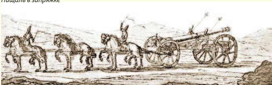
Пищаль в запряжке

По заключенному Андрусовскому перемирию в 1667 г. Смоленщина окончательно перешла к России.