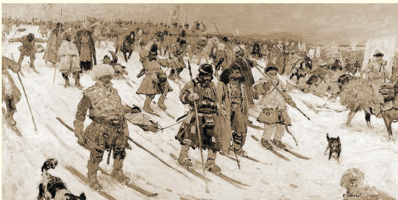
Иванов С. В. «Поход москвитян. XVI век»

тивизировать военные действия и овладеть в сентябре 1614 г. сильной крепостью Гдов, которая прикрывала с севера дорогу на Псков. Ожесточенные схватки продолжались до 1615 г., но в них участвовали только верные правительству казачьи станицы, местные стрельцы и крестьяне. Шведам, потерпевшим поражение при осаде Пскова и под Тихвином, не удалось достичь поставленных целей. В 1615 г. было заключено перемирие, а в 1617 г. — Столбовский мирный договор.