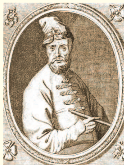
Василий Борисович Шереметев

Ввиду численного превосходства польско-крымского войска Шереметев с Хмельницким выбрали оборонительный вариант. Русско-казачьи полки по обычной казачьей тактике того времени укрылись в таборе (укрепление из