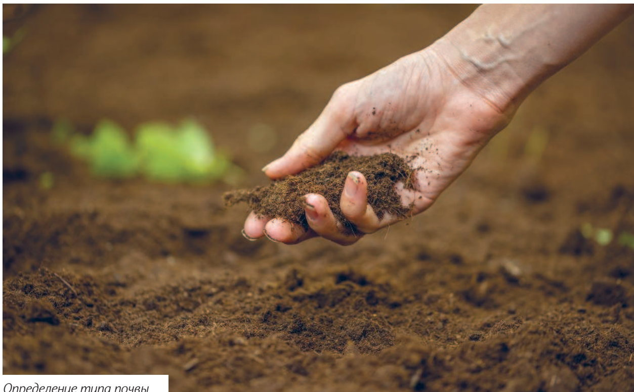
Определение типа почвы