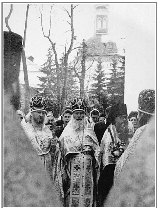
На Светлой седмице в Лавре