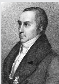
Карл Густав Карус, один из «предтеч» психоанализа. Гравюра серед. XIX в.

Но не менее значимым в работах Фрейда со временем становится и герменевтический — толковательный — аспект. Ученый и практик призывал к пониманию — не важно, научного предмета, произведения искусства или человека и его проблем. Легко понять