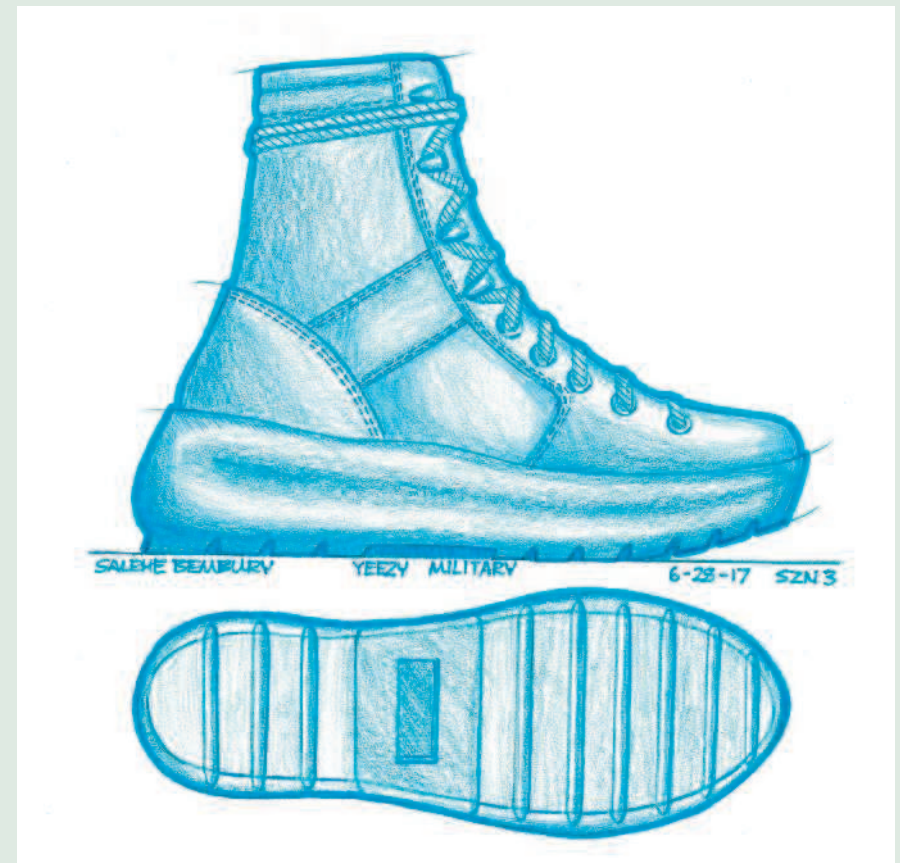
→ Обувь Yeezy Season 3

Теперь же все законы дизайна в некотором смысле нарушены. В мейнстрим вливается новая потребительская база, а с новыми потребителями возникают и новые правила. Теперь кроссовки выглядят как живые организмы; выглядят как космические корабли. Как дизайнер обуви, я воодушевлен тем, что могу быть частью новой эпохи.