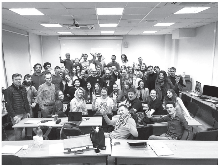
Студенты-фильммейкеры Высшей школы кино «Арка» с куратором курса Тимуром Бекмамбетовым

А еще фильммейкинг — это первый шаг в «большое кино», в сторону красной ковровой дорожки и вождя Оскара. Хватит горевать о русском кино,