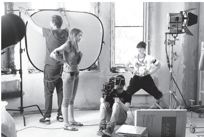
Студенты курса «Фильммейкинг» на съемках