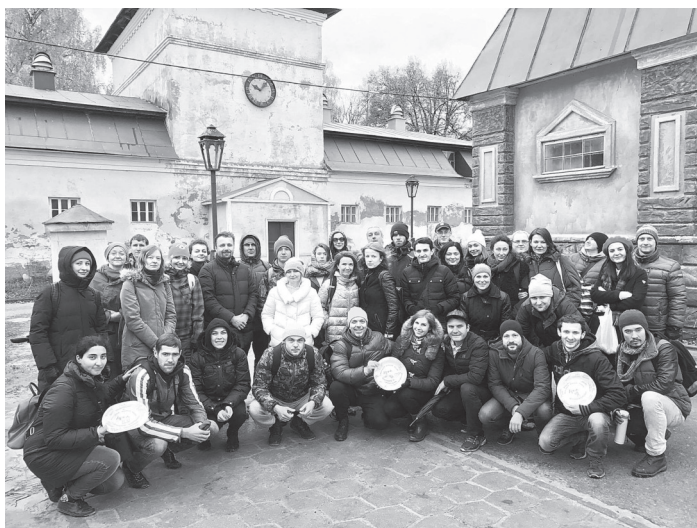
На посвящении в студенты. Горки Ленинские, октябрь 2017 г.

К концу девяностых я уже почти шесть лет довольно успешно занимался рекламно-информационным бизнесом в Саратове, но все еще жаждал перемен — «перестроечные» настроения были еще живы. И вот в феврале 1998 года на отечественные киноэкраны, которых было не так уж много, поскольку отечественный кинопрокат только начинал восстанавливаться после затяжного кризи-