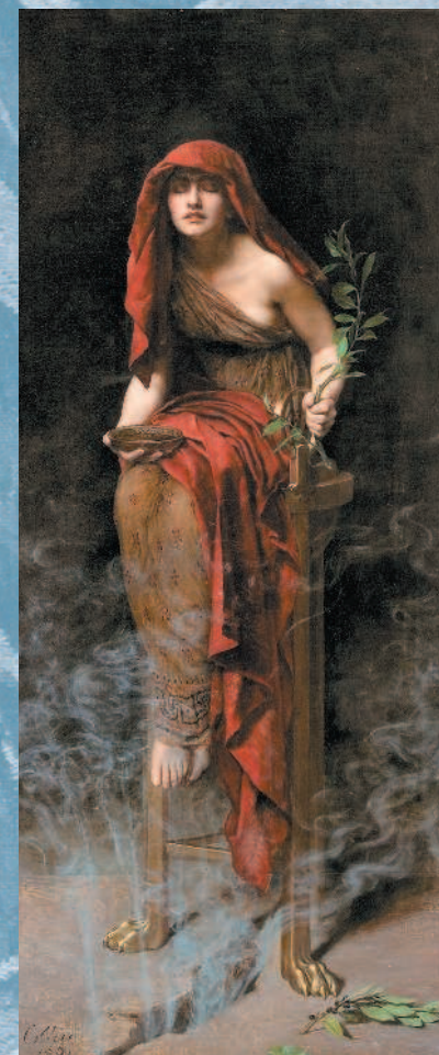
Джон Кольер. Дельфийская жрица. 1891 г.

Все было уже готово для жертвоприношения. Пасть под ножом жреца должен был юный Фрикс, но вдруг явился златорунный овен, дар бога Гермеса. Послала овна мать Фрикса, богиня Нефела, чтобы спасти своих детей. Сели на златорунного овна Фрикс с сестрой своей Геллой, и овен понес их по воздуху далеко на север.