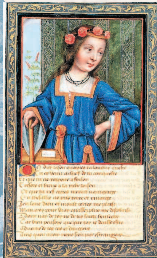
Царица Гипсипила. Миниатюра французской школы. XV в. Хантингтонская библиотека. Сан-Марино.

В честь прибытия героев царица Гипсипила учредила состязания по многоборью (пентатлону), которые включали в себя бег, метание диска и копья, прыжок и борьбу. Таким образом, остров Лемнос стал прародиной современного пятиборья.