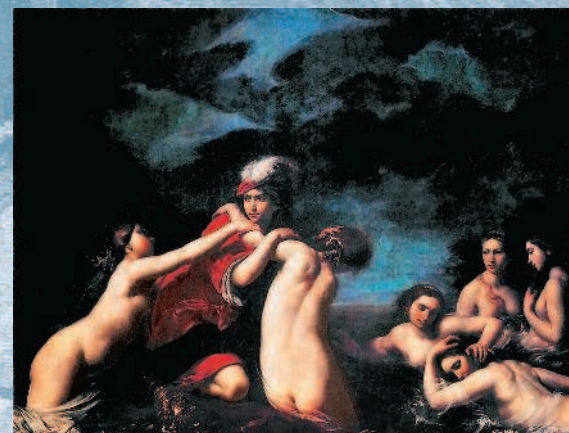
Франческо Фурини. Гилас и нимфы. XVII в. Палаццо Питти. Флоренция.