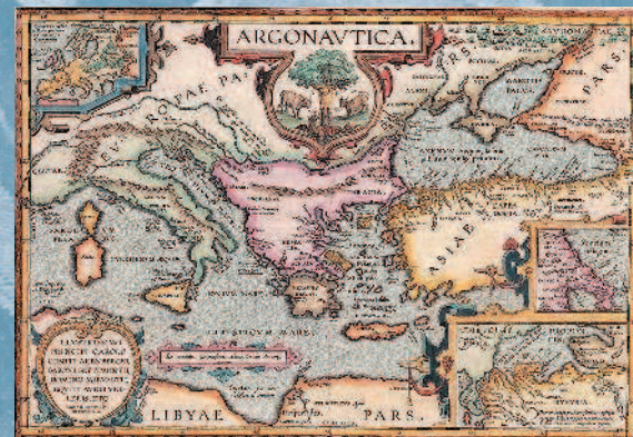
Карта путешествий аргонавтов в интерпретации Аполлония Родосского. Оттиск Абрахама Ортелиа, 1624 г.

А аргонавты, лишь только взошла на небо лучезарная утренняя звезда, предвещающая скорое наступление утра, отправились в путь, не заметив в предрассветных сумерках, что нет среди них ни Геракла, ни Полифема. Опечалились герои, увидав, когда наступило утро, что нет между ними двух славнейших товарищей. Опустив голову, сидел в горе Ясон;