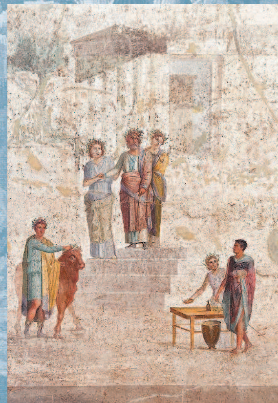
Пелий , царь Иолка, узнает молодого Ясона по отсутствию сандалии на одной ноге, римская фреска, I век н. э.

Так ответил Пелий Ясону, затаив злобу в сердце. Он верил, что погибнет Ясон, если решиться отправиться за золотым руном в Колхиду.