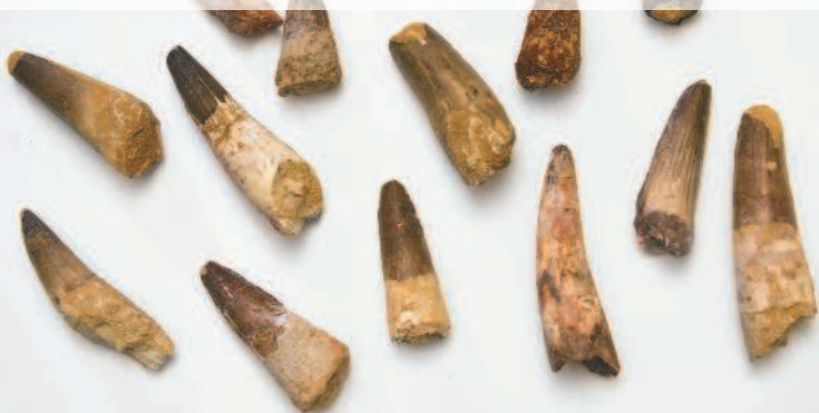
Коллекция ископаемых останков — зубов доисторических ящеров.

К настоящему моменту учеными открыто около 900 представителей динозавров. И все они были очень разными: маленькими и огромными, травоядными и плотоядными, неповоротливыми и молниеносными, бегающими на двух ногах и передвигающимися на четырех конечностях, с рогами и шипами и без них. И все это мы знаем благодаря ученым-палеонтологам, которые с каждым годом делают все больше интересных открытий и находок.