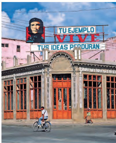
Великого Че почитают и в Сьенфуэгос

На третий день вас опять ждет море, так как вы в течение часа доберетесь до курортного города Плайя-Санта-Лусия 13 › с. 103, расположенного в 110 км к северо-востоку от Камагуэй. Здесь вас ждут сказочный пляж (правда, иногда с водорослями) и несколько недоро-