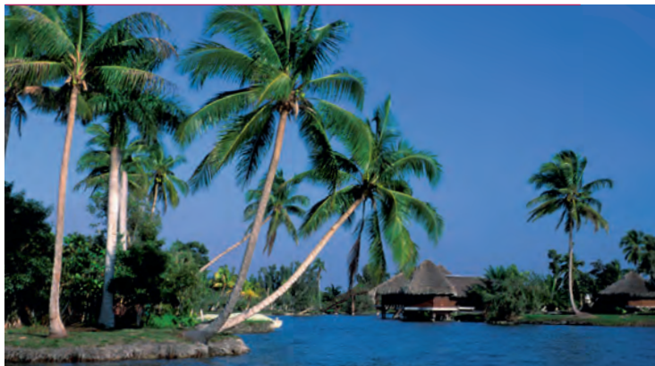
Карибский рай в Лагуне-дель-Тесоро на полуострове Сапата

заняты плодородными пастбищами, а ее одноименная столица также находится под охраной ЮНЕСКО.