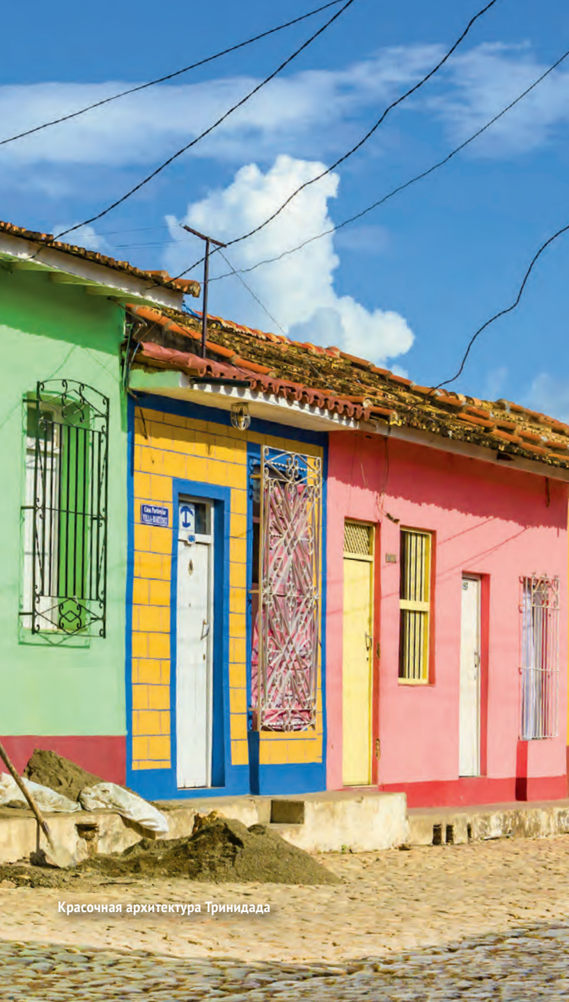
Красочная архитектура Тринидада