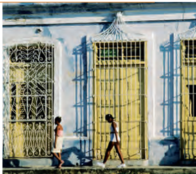
Пышная архитектура Тринидада

ваются, но обратно в море возвращаются не все – многие из них оказываются под колесами грузовиков. Особенно этому рады грифы-индейки, ведь о такой легкой добыче им можно только мечтать. Наиболее удачные фотографии Тринидада можно сделать при мягком вечернем свете и ранним ясным утром, к тому же в это время на улицах не так много туристов. Через долину Инхеньос 3 > с. 94 с ее