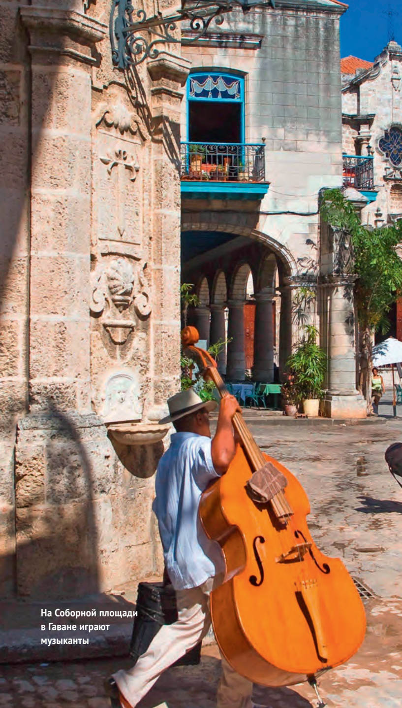
На Соборной площади в Гаване играют музыканты