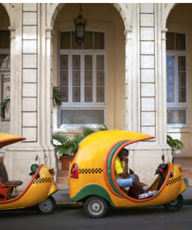
Cocotaxis в ожидании пассажиров

Хотя движение на острове не очень интенсивное, нужно соблюдать осторожность. Поворотные огни у многих либо не работают, либо их просто не включают (обращайте внимание на знаки, который подает водитель машины перед вами: например, поднятая вверх рука означает, что он хочет повернуть налево!). Обгон справа считается обычным делом. Велосипедисты часто пересекают дорогу, как им вздумается, много железнодорожных переездов без шлагбаумов и со слишком высокими рельсами. На автострадах встречаются огромные ямы, поэтому разрешенная скорость в 100 км/ч часто бывает опасной (вне населенных пунктов 80 км/ч, в населенных пунктах 50 км/ч). По ночам на теплом асфальте часто греются коровы. А еще кубинцы любят встречаться на променаде, проложенном в центре автомагистрали.