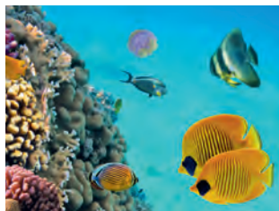
Коралловые рифы – рай для дайверов

Постоянно дующие пассаты обеспечивают идеальные условия для занятий парусным спортом. Парусные и серфовые школы с прокатом оборудования есть во всех отелях класса люкс, а также в портах.