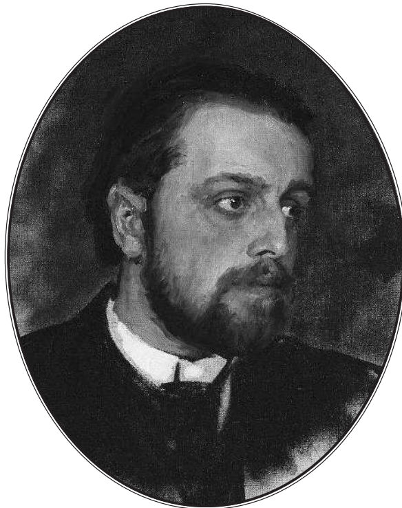
И. Е. Репин. Портрет Владимира Григорьевича Чертова. 1872 г.

«В отделении я остался один со Львом Николаевичем; Душан 4 и Булгаков 5 уселись в соседнем отделении. Я прилег отдохнуть, но мне не спалось. Л. Н., полулежа на противоположном сиденье, стал читать книгу. Встав, чтобы откинуть упавший на него шнур с опущенного верхнего дивана, он загляделся в открытое окно на красный закат. Долго выделялась на фоне окна его несколько согнувшаяся вперед сутуловатая фигура. Он, видимо, любовался зрелищем. Немного погодя, он, не двигаясь с места, посмотрел на свои