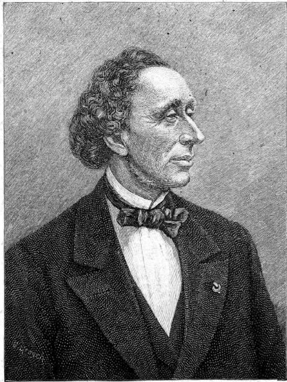
Портрет Ганса Христиана Андерсена. Гравюра из книги 1896 года издания