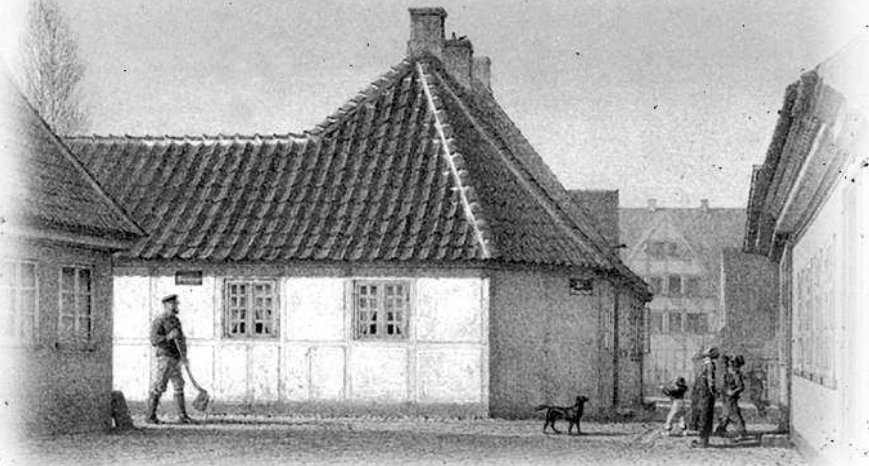
Дом Андерсена в Оденсе. Старинная гравюра

цветами и ветками. Обычно он тонким голосом распевал песни, и свора мальчишек бежала за ним с дикими воплями. Даже тогда, в детстве, Андерсен чувствовал, что многое унаследовал от деда. Чувствовали это и окружающие. Нередко ему приходилось слышать насмешливые слова своих сверстников: «Ты такой же сумасшедший, как и твой дед». Но, видно, беспокойной была вся мужская ветвь Андерсенов.