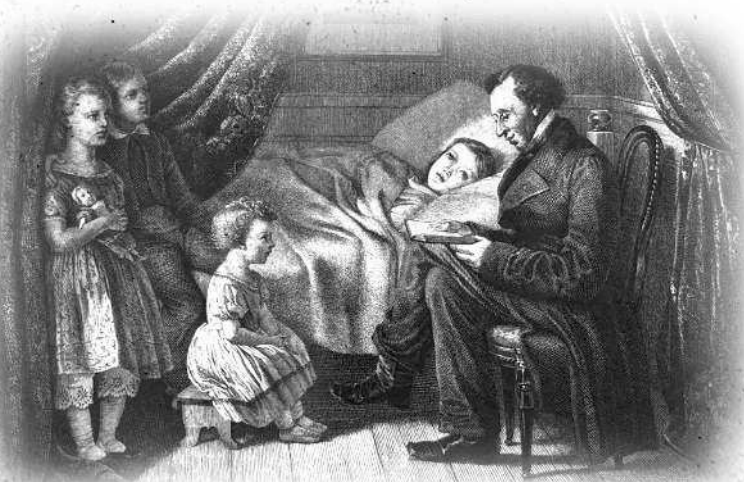
Ганс Христиан Андерсен читает сказки детям

Многие из сказок, что были рассказаны детям, не дошли до наших дней. Андерсен их не записывал, считая, что посиделки с детьми — всего лишь шутка или развлечение. И только в 1836 году, когда писателю был 31 год, он решил выпустить первый сборник сказок, который так и назвал «Сказки, рассказанные детям». Это была тоненькая брошюрка, в которую вошло всего четыре волшебных истории. Их оказалось достаточно, чтобы взорвать общество и заставить его говорить только о нем. Талантливый скульптор и тезка Андерсена Ганс Христиан Орстед, прочитав первый сборник сказок, сказал: «Благодаря „Импровизатору“ ты стал знаменит, а сказки сделают тебя бессмертным».