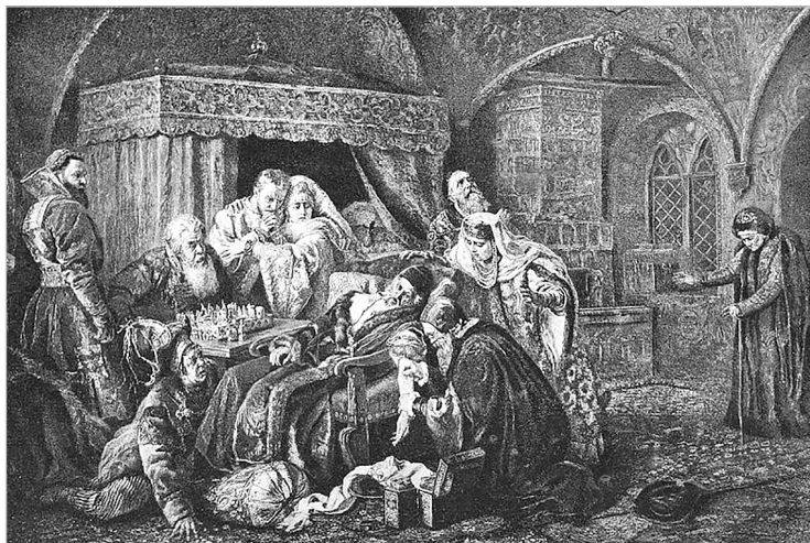
К.Е.Маковский. Смерть Ивана Грозного. 1888

опричниками было вырезано 15 тысяч человек при общем населении 30 тысяч, а еще были Тверь, Клин, Торжок... В результате такой политики сельское хозяйство, составляющее основу экономики, пришло в полный упадок; северо-западные земли, бывшие некогда экономическими флагманами, — разорены и практически безжизненны.