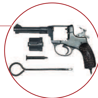
Рамка монолитная неразъемная