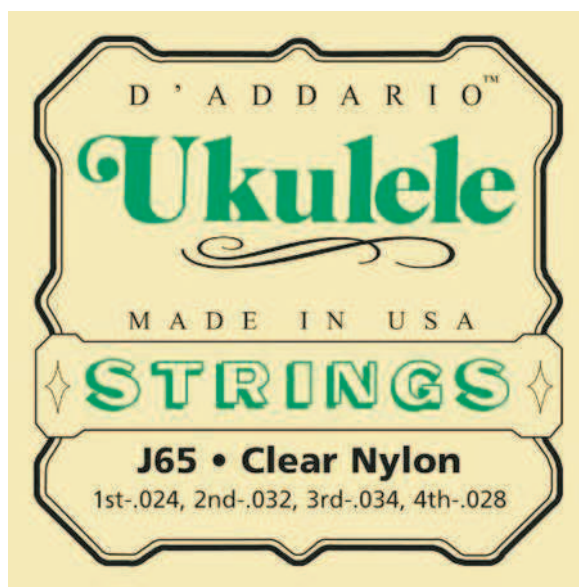
ЗАПАСНЫЕ СТРУНЫ (СТР. 42—43)