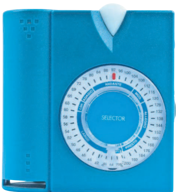
МЕТРОНОМ (СТР. 25)