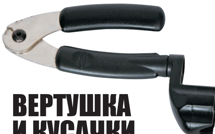
ВЕРТУШКА И КУСАЧКИ ДЛЯ СТРУН (СТР. 42)