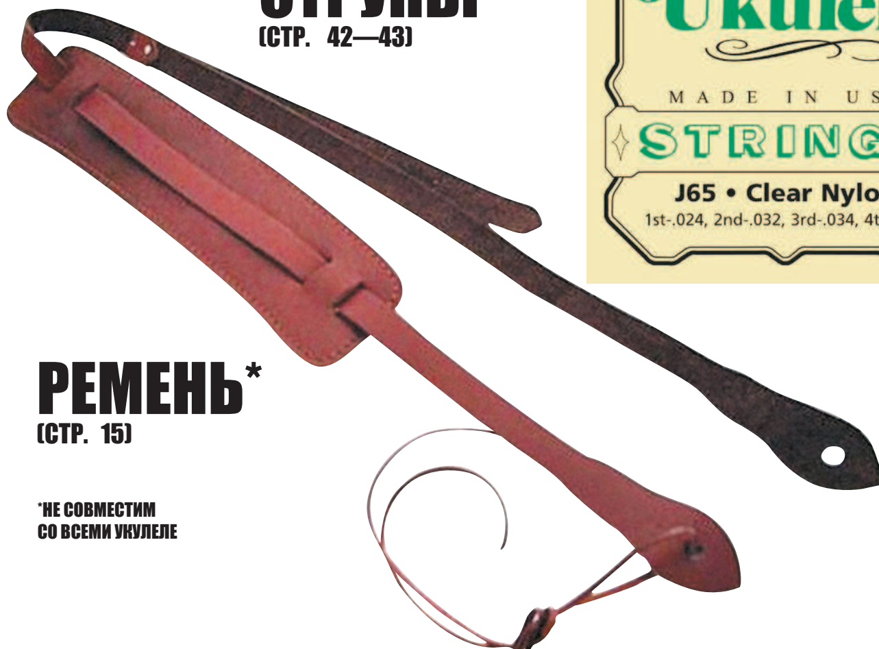
РЕМЕНЬ* (СТР. 15)