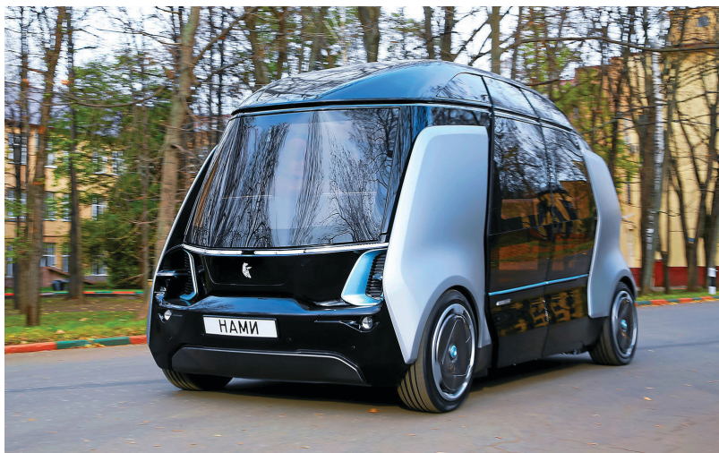
Рис. 1.1. Внешний вид российского БПТС «Шаттл» совместного производства НАМИ и КамАЗ

«НАМИ», в 2016 году представлен на Московском международном автосалоне. Внешний вид дан на рис. 1.1.