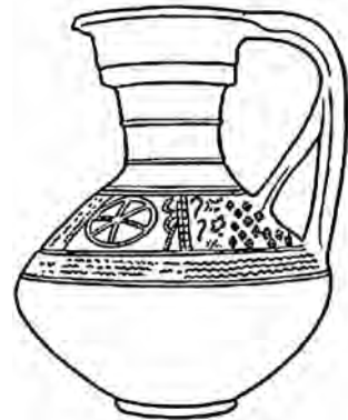
Ритуальный сосуд-календарь 4 века (Киевщина)