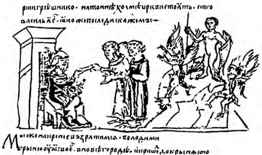
Святилище на Благовещенской горе во Вщике

В отношении западных славян хорошо известно, что их храмы служили не только духовным целям, но и целям астрономии.