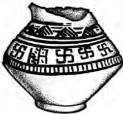
Сосуд-календарь из Смелы. Скифское время

личилась на 3 дня – солнцестояния стали приходиться на 12 июня и 12 декабря, о чем народ знал. Об этом говорит своеобразный обряд, совершавшийся в XVI веке в Московском Кремле. И он явно является рудиментом более древних сакральных обрядов дохристианской Руси. В день Спиридона перед царем отчитывался звонарный староста кремлевского собора как блюститель часобития (звона часов), бил челом и докладывал, что «отселе возврат солнцу с зимы на лето, день прибывает, а ночь умяется». За эту радостную весть царь жаловал старосту деньгами – выдавалось 24 рубля серебром. На летний солнцеворот (12 июня) тот же докладчик приносил весть: «отселе возврат солнцу с лета на зиму, день умяется, а ночь прибывает». За эту прискорбную весть его запирали в темную палатку на ивановской колокольне не менее чем на 24 часа.