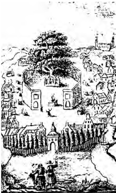
Языческие святилища в городе Ромов