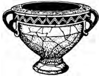
Гадательный сосуд-календарь из Лепесовки 4 век (Украина)