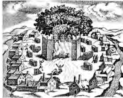
Одно из западно-славянских (прусское) святилищ, по образцу коих строились новгородские