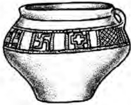
Сосуд-календарь из Балтийского Поморья