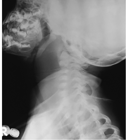
Рис. 3.2. Обзорная рентгенограмма шеи в боковой проекции ребенка с ретрофарингеальным (заглоточным) абсцессом, иллюстрирующая значительное расширение превертебрального пространства

глухенный или по типу «горячего картофеля» голос. Если пациент стабилен, то при наличии дисфонии для оценки возможной скомпроментированности дыхательных путей следует выполнить гибкую волоконно-оптическую ларингоскопию.