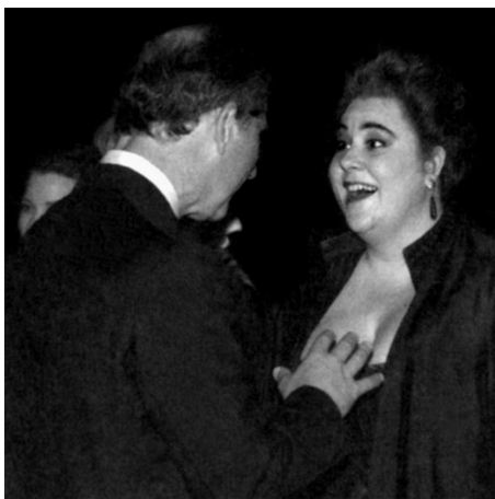
Принц Чарльз нашел пикантную собеседницу

ствам, которые человек испытывает в данный момент. Например, мужчина, осознающий, что начинает полнеть, может в минуту задумчивости пальцами крутить складку под подбородком. Женщина, понимающая, что у нее слишком полные бедра, будет бессознательно одергивать юбку и тянуть ее вниз. Человек, испытывающий страх или занимающий оборонительную позицию, скрещивает руки или ноги. Мужчина, разговаривающий с пышногрудой собеседницей, сознательно старается не смотреть на ее грудь, однако в то же время неосознанно совершает ощупывающие жесты руками.