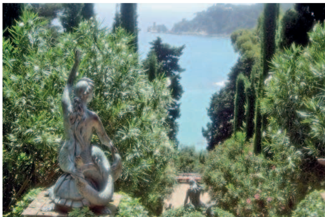
Сады святой Клотильды

Вечер. Вернувшись в Льорет-де-Мар, почувствуйте его неповторимую ночную жизнь. Если вас не интересуют тусовки, можете устроить себе спокойный вечер – спуститесь от автовокзала в сады святой Клотильды и подышите воздухом, наполненным ароматами, которые источает средиземноморская флора.