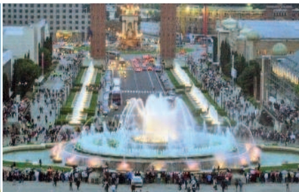
Волшебные фонтаны на площади Испании Храм Саграда-Фамилия