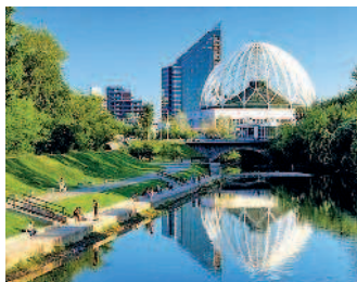
Набережная реки Исеть