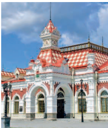
Железнодорожный вокзал в Екатеринбурге