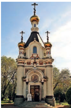
Часовня Святой Екатерины