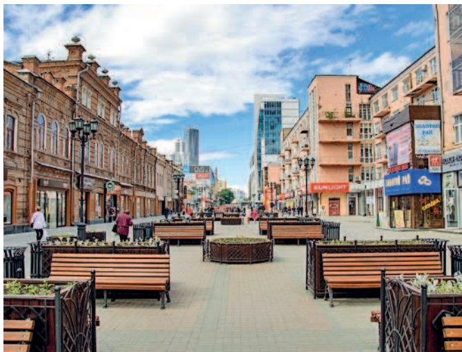
Пешеходная улица Вайнера

Вечер. Для более изысканного ужина выберите ресторан Noble House (▷ 93) в соседнем отеле Hyatt Regency Ekaterinburg.