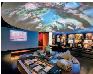
Президентский центр Б. Ельцина