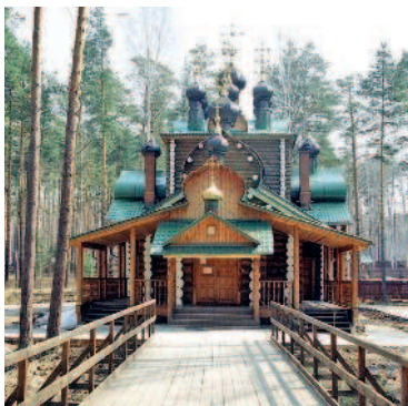
Монастырь Святых Царственных Страстотерпцев на Ганиной Яме

Вечер. После такого паломничества вы, конечно, заслужили хороший ужин в ресторане Momo Pan Asian Kitchen (▷ 57) или Pan Smetan (▷ 59).