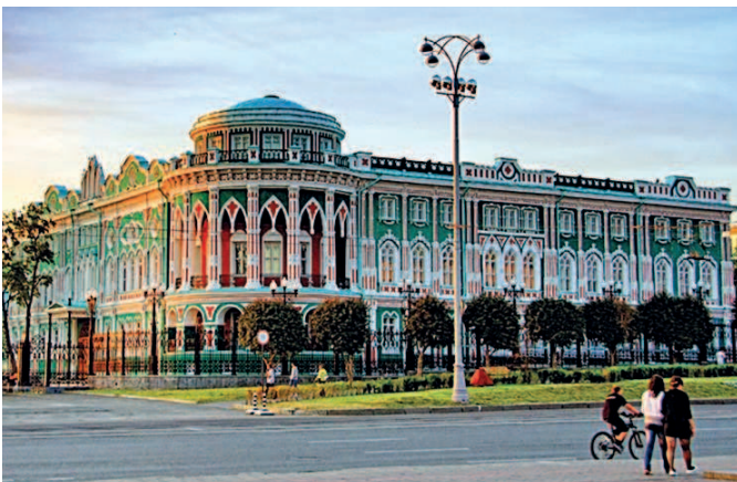
Екатеринбург. Дом Севастьянова