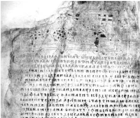
Первый лист «Повести временных лет» Нестора Летописца