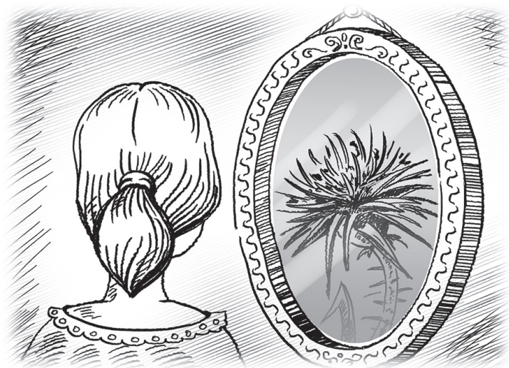
Рис. 2. Зеркало для Любы

ла в гостях, нарушая тишину и досаждая хозяевам. После ее визита приходилось убирать, исправлять и чистить вещи в доме. Как благовоспитанные люди, взрослые не делали замечаний госте, не высказывали своего мнения явно, понятными ребенку словами. Это не принято, ведь люди стараются не обидеть того, кто пришел к ним в дом.