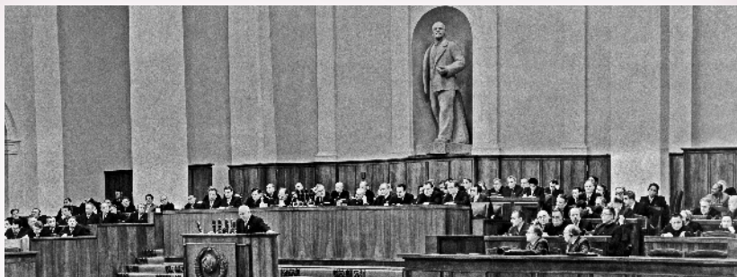
Выступление Н. С. Хрущева на съезде КПСС

Сергеевича Хрущева в 1961 году; до того времени съезды коммунистической партии проходили в Большом Кремлевском дворце, исторической резиденции российских императоров. И ради этого во дворце в сталинское время даже уничтожили два замечательной красоты парадных зала — Александровский и Андреевский. (В 1990-е они восстановлены в первоначальном виде.) Хрущев же перенес съезды в новое здание, что само по себе было, конечно, благом. Да и зал во Дворце съездов был больше, туда помещалось аж целых 6000 депутатов.