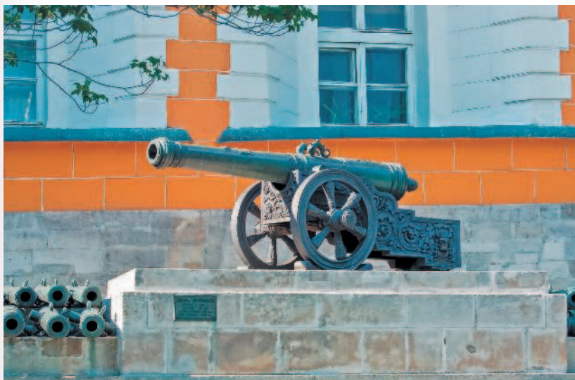
Пушки у стены Арсенала

Следующим зданием по левую руку будет Сенат . Так здание традиционно назы-