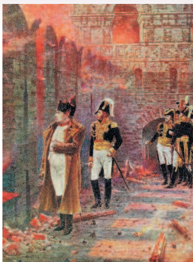
Верещагин В. В Кремле — пожар!

С Наполеоном мы не закончили, потому что на протяжении всего похода по Кремлю будем наткаться на следы его