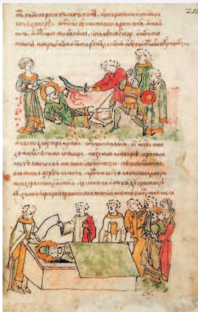
«Убиение Андрея Боголюбского». Миниатюры из Радзивилловой летописи