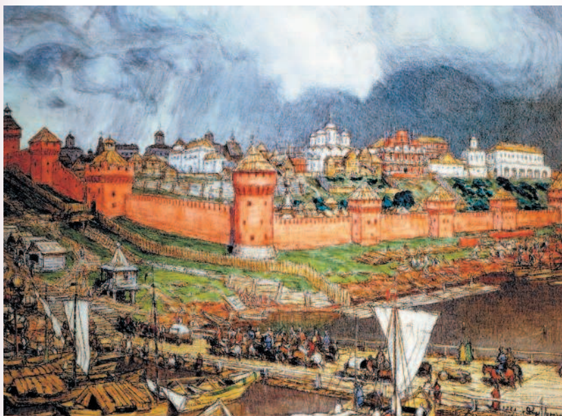
Васнецов А. Кремль при Иване III

Обычно тут вспоминают четырех архитекторов, хотя, конечно, их было больше: каждый приезжал с учениками, подмастерьями, а некоторые даже со своими каменщиками. Назовем их имена. Это Рудольфо Фиораванти, Пьетро Антонио Солари, Марко Руффо и, наконец,