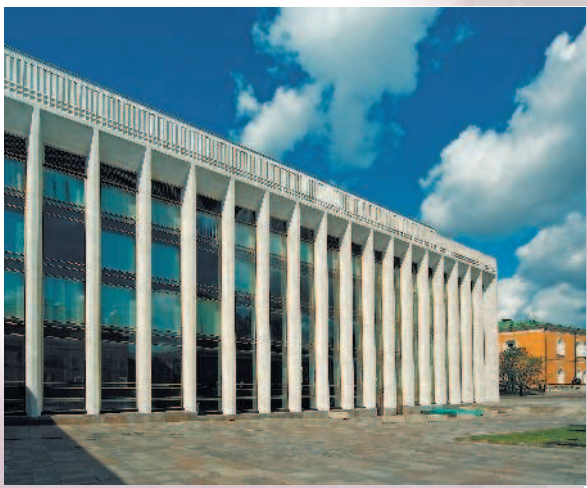
Кремлевский дворец съездов

Это Кремлевский дворец съездов . Сейчас он, впрочем, называется Государственный Кремлевский дворец. Но я на экскурсиях использую его советское название. Эту огромную железобетонную коробку построили по приказу Никиты