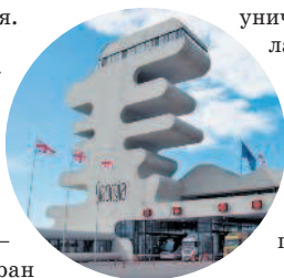
Пограничный переход в Сарпи

уничтожил таможню, и всем автоладельцам пришлось возвращаться домой через Азербайджан. В июне 2016 года сошел с рельс с тем же результатом. Рекомендуется найти в интернете какой-нибудь регулярно обновляемый ресурс с информацией по этой таможне. Такие есть.