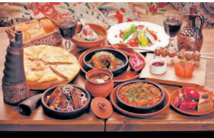
Блюда грузинской кухни