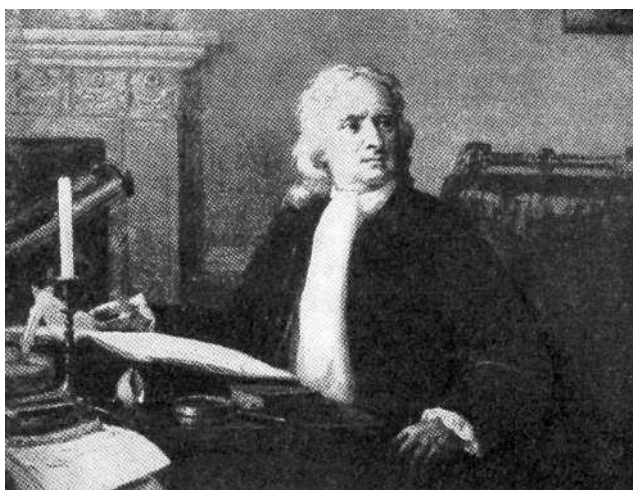
Английский ученый Исаак Ньютон