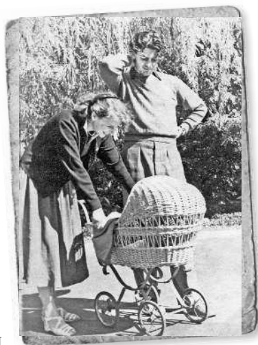
Та самая коляска

Наверное, это самая трогательная фотография моего детства, именно она во всех папиных мемуарах иллюстрирует появление долгожданного сына! Но есть один нюанс: на этой картинке я появился только как медийный персонаж! Непонятно? Приглядитесь внимательнее к коляске... Видите?.. Нет?.. А сейчас? Да! Правильно! Она пуста!!! Дело происходит на съемках. Моя будущая мама приехала проводить моего будущего папу, и там, в реквизите, нашлась очень красивая коляска. Родители просто сфотографировались на ее фоне! Ну а чего еще