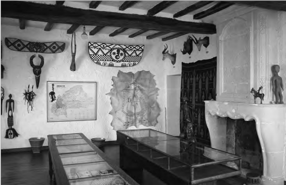
Музей Шарбонно-Лассэ в Лудюне

жались еще с 1890 по 1894 гг. Музей вырос напротив здания Коломбьер, занимаемого иезуитами с 1873 года.