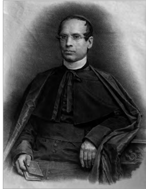
Кардинал Жан-Батист-Франсуа Питра (1812–1889)