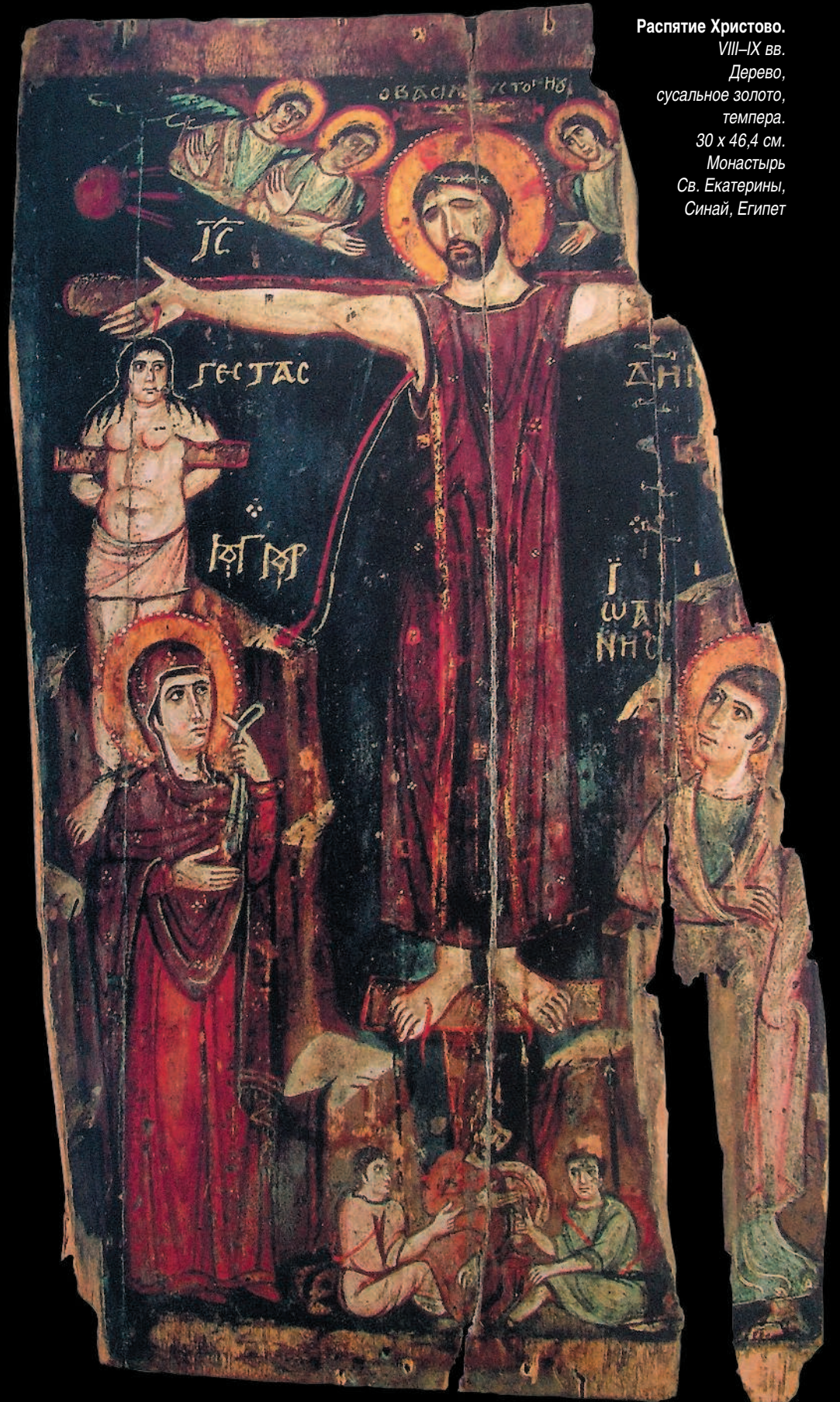
Распятие Христово. VIII–IX вв. Дерево, сусальное золото, темпера. 30 x 46,4 см. Монастырь Св. Екатерины, Синай, Египет

Греческий Восток развивал идейные стороны веры и, одновременно, ту практику, которая, на основе глубоких и незабываемых преданий Древнего Египта, построила его обширные и наполненные художественными памятниками некрополи, и которая затем перенесла образцы священной старины в ближневосточную иконопись.