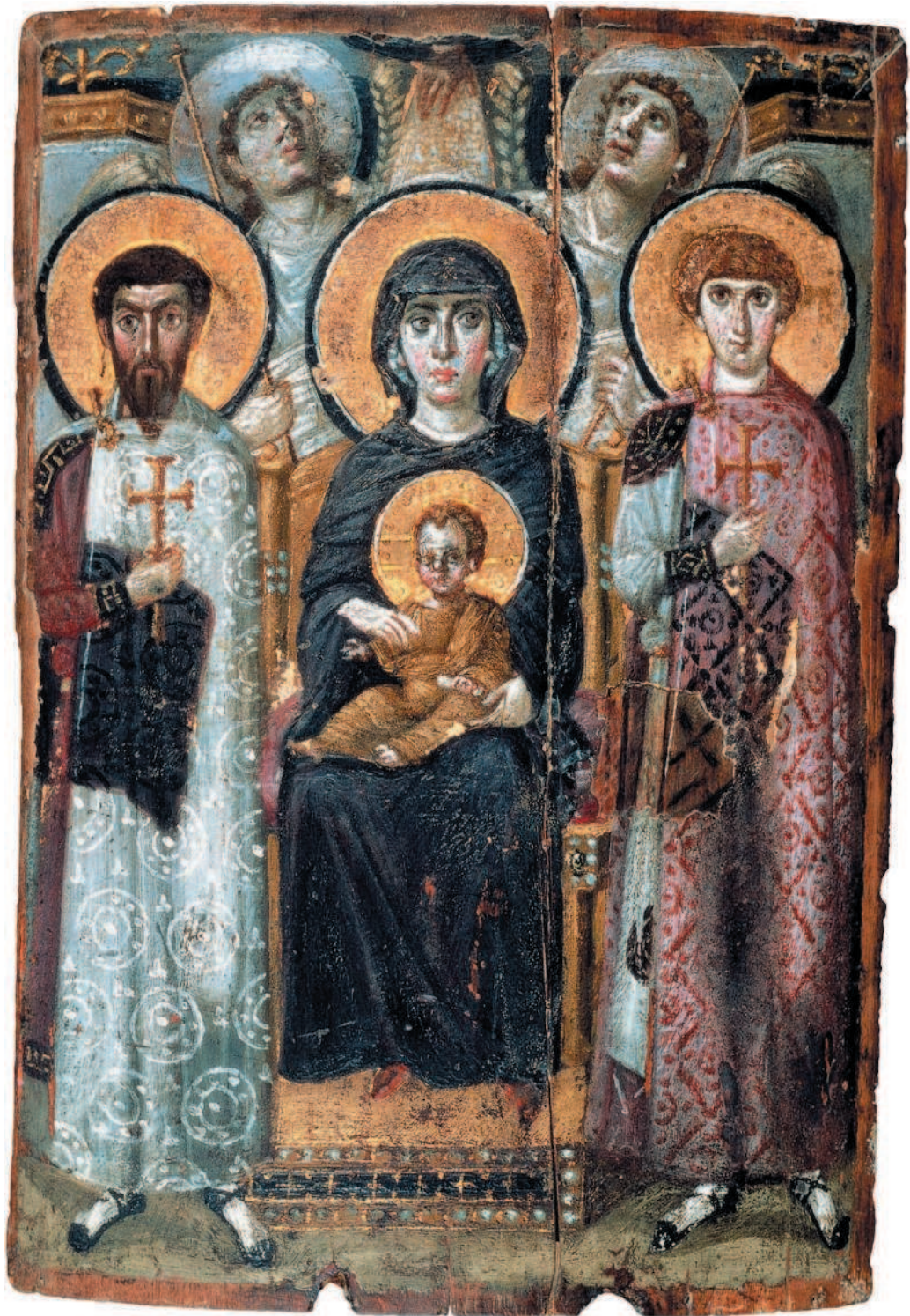
Богоматерь с Младенцем и предстоящими святыми. VI в. Дерево, энкаустика. 50 x 69 см. Монастырь Св. Екатерины, Синай, Египет