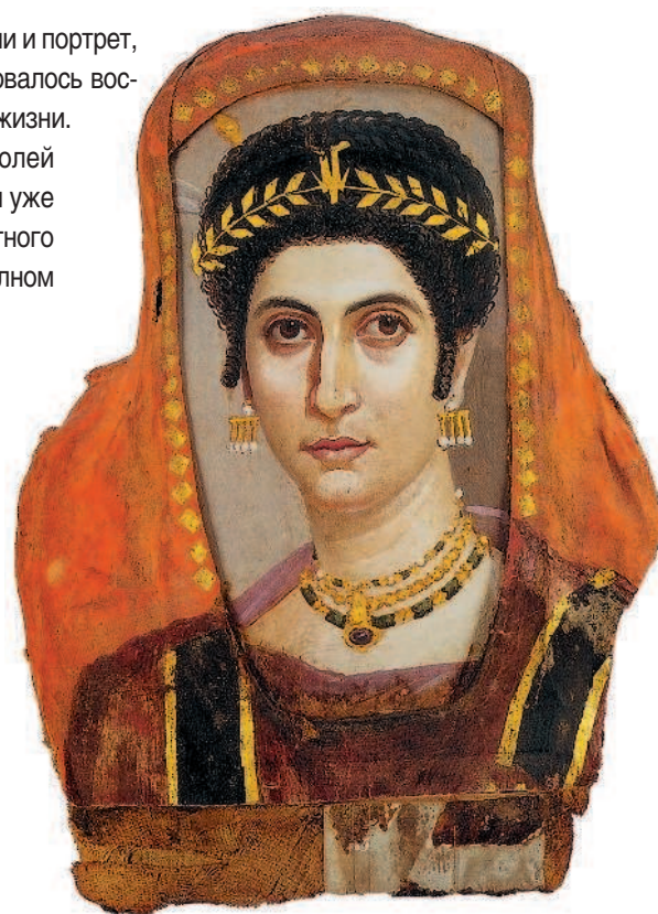
Фаюмский портрет. Конец I — начало II в. Дерево, энкаустика, сусальное золото. Британский музей, Лондон

Энкаустика, или восковая техника, употребляла, как известно из Плиния, краски, разведенные на расплавленном воске и, помимо кистей, пользовалась металлическими палочками, которые плавил застывший мазок, сообщая ту прозрачную глубину, которая дается лишь масляной живописью.