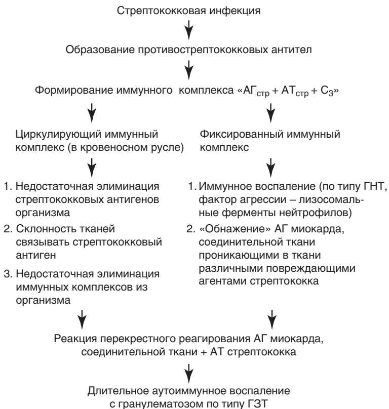
Рис. 1.1. Патогенез острой ревматической лихорадки

Патогенез острой ревматической лихорадки представлен на рис. 1.1, 1.2.